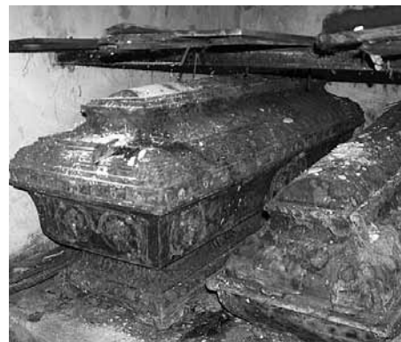
A sírbolt mai állapota