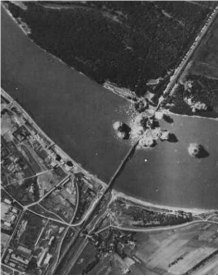
A bombázás percei felülről

Az egyik bomba eltörte a lábát, a másik megtörte gerincét, és a híd két középső át-hidalása, amelynek szolgálatát eddig szinte észre sem vették, elindult a halak birodalmába. A fél órán belül bekövetkezett második támadás után már három hídelem feküdt a meder fenekén.