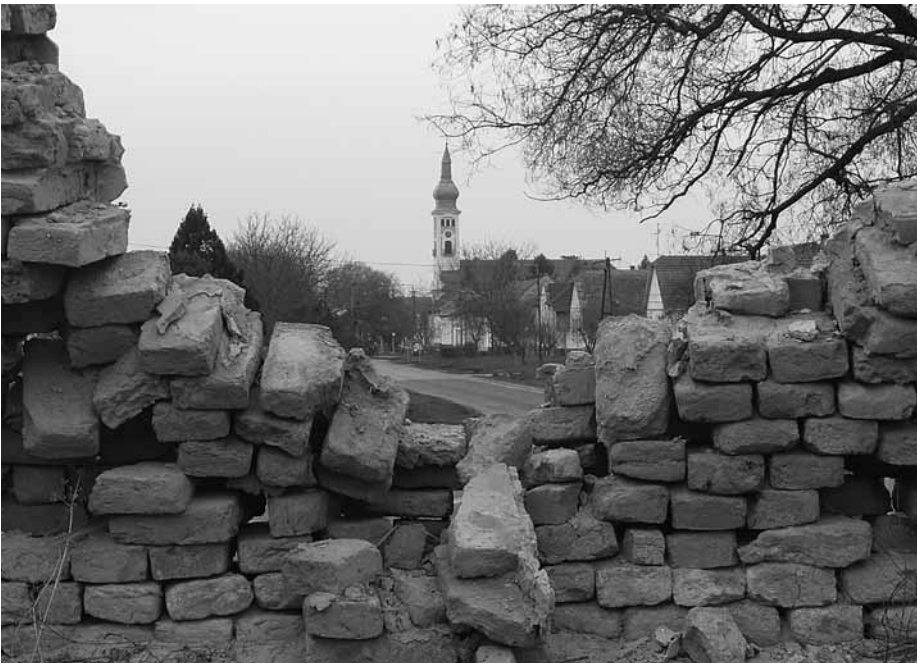
Ennyi maradt az egykori kastélyból

csupán az egykoron a főkapuhoz tartozó egyik megcsonkított állatszobor hívja fel az arra járók figyelmét a volt kastélyparkra. A „park” megnevezést már nem is használhatjuk a területre, ugyanis az jobban hasonlít egy erdőrészeletre, mint egy valaha szemet gyönyörködtető nemesi parkra. A terület nagyon elhanyagolt, a bozót mindent beborít. A tó még megvan, a falusiak horgásznak benne. A Latinovitsok idejében többször is kikotorták a medrét, ez a munkát azóta nem ismétlődött meg. Közepén egy kisebb, gazzal borított földhalom emlékeztet minket a valaha sokkal szebb képet mutató nagyobbik szigetre. Az életveszélyes hidat az utóbbi években lebontották, pedig egy kis helyreállító munkával legalább ezt meg lehetett volna menteni az utókornak.