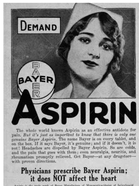
Régi Aszpirin-reklám Amerikából

Noha az Ebers-tekercs szerzőjének kiléte rejtély, egykori tulajdonosa valószínűleg egy igen magas rangú egyiptomi orvos volt, akinek múmiája mellől emelték el az Abd er-Rasul testvérek. És bár a papirusz sírba került, az egyiptomi orvosok tudása tovább öröklődött, a fűzfa kérge az ókori görög orvosok legjelentősebbje, az orvostudomány atyja, Hippokratész ajánlása folytán az ókor gyógyszerlistájának állandó eleme lett, és maradt több száz éven keresztül. „A Római Birodalom bukása után azonban kegyetlen idők következtek. Feledésbe merült a több ezer év alatt felhalmozott tudásanyag nagy része, köztük több gyógyszer is, mint például a fűzfa”, amely „csak a 18. században tért vissza a köztudatba, amikor egy orvosi vénával megáldott falusi lelkész újra felfedezte mindazt, amit az ókori egyiptomiak ezer éve tudtak. A növény csupán ekkor került méltó helyére”. Hogy 1758 Szent János napján mi indította az akkor 56 éves, váltóláztól és ízületi gyulladástól gyötört Edward Stone tiszteletet arra, hogy saját birtokán, egy kis patak menti fűzfáról letörjön egy darabka kérget, és azt a szájába vegye? „Valószínűleg merő kíváncsiságból tette.” Hogy a fűzfakéreg „megkóstolása” kapcsán mit tapasztalt, tapasztalása milyen fantasztikus gondolatokra ragadtatta, azt követően pedig a megszártított és malomban megőrölt fűzfakéreggel végzett ötvennyi sikeres kísérletezése milyen eredményekhez vezetett, a könyvből kiderül. Ugyanakkor arra is választ kaphatunk, mi történt évekkel