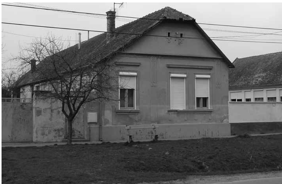
Az utolsó állomás: a Matos-ház

életükben arisztokrata életformához szoktak, a község éllete számukra ismeretlen volt. Szerencsésükre a falu értelmiségének egy része támogatta őket, és kiállt mellettük.