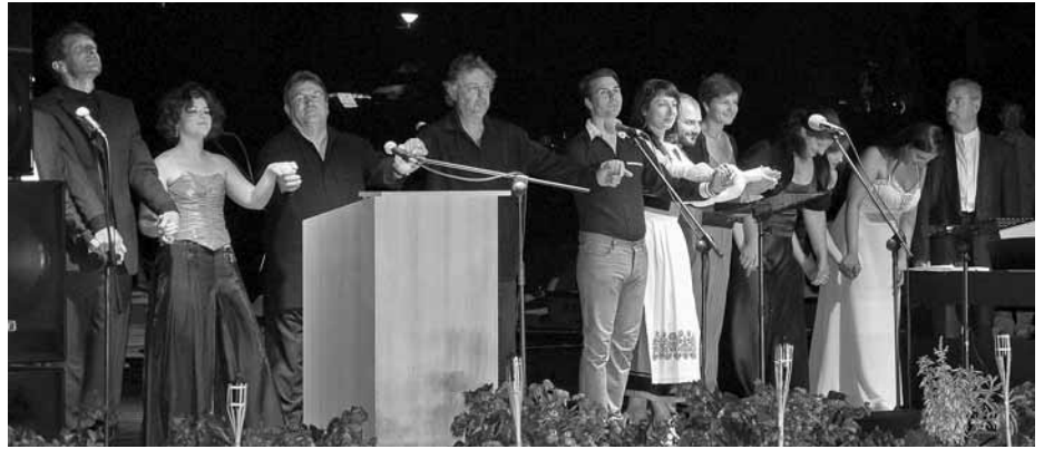
Tanítványok és kollégák gyűjűjében a bajai víziszínpadon. Kelemen Áron felvételei

– A zárókoncertünk mindig teltházas. Engem a környékhez egyébként is rokoni szálak kötnek. Minden évben legalább egyszer jövök ide a kurzus miatt, de év közben is adódhat valamilyen fellépés. S ha esetleg Pécsről hazafelé menet megállok itt enni valamelyik jó étteremben, akkor ismeretlenek is köszöntenek. Odajönnek, érdeklődnek, mikor látnak ismét a színpadon. Olyan, mintha hazajönnék. Nagyon szeretem ezt a várost, és kicsit csodálkozom azon, hogy még csak ilyen kevéssé fedezték fel az emberek, hiszen itt hemzsegnie kellene a turistáknak. A nagyobb városok, mint Pécs vagy Szeged, sokkal inkább benne vannak a köz tudatban, de egy ilyen gyöngyszem, ilyen