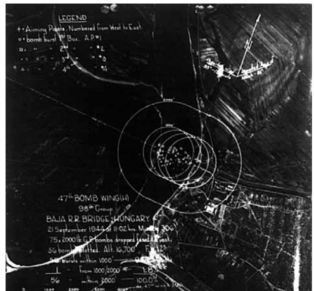
Baja mint célpont

Tudták, mit jelent, ha bemondták: „Achtung! Achtung! Baja, Bácska, légiveszély!”. Sípolt, sivított minden, haragoszöldre váltott a korábban barátságos táj. Barna, fekete, vad, habzó szökőkutak törtek a magasba, regett, rángatózott a talaj és recsent a híd.