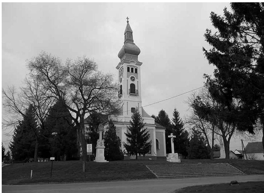
A katymári plébániatemplom

Az egykori kastélypark: Aki napjainkban bemegy a megmaradt, omladozó téglafal mögé, annak szinte elképzelhetetlen, hogy száz évvel ezelőtt milyen élet folyt a falak között. Az üvegháznak, tenispályának ma nyomát se látni. A falu főutcájáról