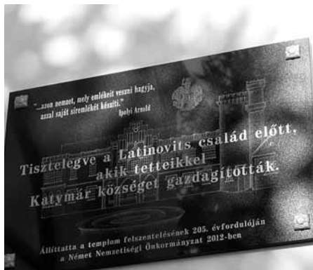
A Latinovitsok emléktáblája a templomban

A templomon kívül egy újabb Latinovits-emléket fedezhetünk fel. A plébániatemplom felszentelésének 205. évfordulója alkalmából 2012-ben a Német Kisebbségi Önkormányzat emléktáblát állíttatott, „Tisztelegve