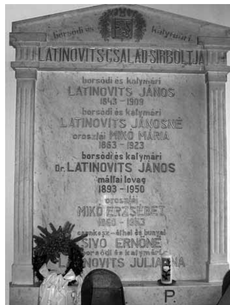
A Latinovits-kripta bejárata

a Latinovits család előtt, akik tetteikkel Katymár községet gazdagították”. Idősebb is volt, hogy kézzel fogható emléket állítsanak a családnak. Sok falubeli szinte már nem is tudja, kik voltak a Latinovitsok, és mi volt azon a téglafalon belül, amely mellett mindennap elmennek. Akik láthatták a falon túl élőket és kastélyukat, lassan kihalnak, így az emlékek elfelejtődnek. Eddig nem mutatkozott túl nagy hajlandóság a katymáriak körében a múlt értékeinek, a Latinovits család emlékének ápolására. Reméljük, hogy ez az emléktábla-állítást ennek a folyamatnak az első lépése volt.