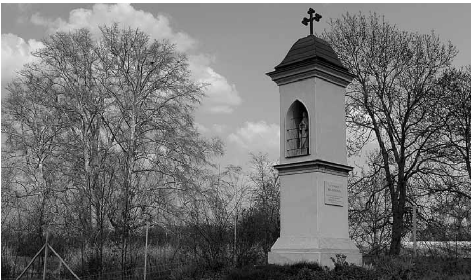
Az elárvult Mária-szobor