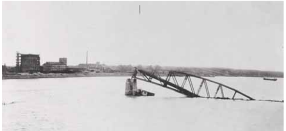
A lebombázott Duna-híd

A háború még évekig kísértette a Duna mentén. 1946-ban a Kujbisev és a Töhötöm, 1947-ben a Tas vontató és 1951. július 22-én sok halálos áldozatot követelve a Dömös kerekas gőzös alatt robbant fel egy-egy mágneses akna. A szerencsének