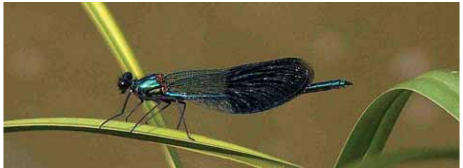
Jól látható az összecscukott szárnyakkal pihenő hím sávós szitakötő sötét szárnyfoltja

Írásunkban a hazánkban a domb- és síkvidéki vizek mentén általánosan elterjedt (a folyóvizekhez képest állóvizekben ritkább), a bajai Duna-szakaszon is előforduló, az egyenlőszárnyú szitakötők ( Zygoptera ) alrendjébe és a színesszárnyú szitakötők ( Calopterygidae ) családjába tartozó sávós szitakötővel ( Calopteryx splendens ) foglalkozunk részletesebben. A családnak még egy