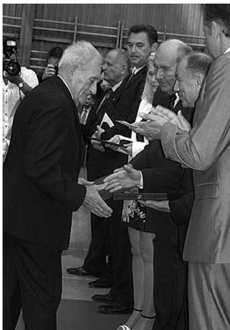
Számos tisztelője köszöntötte a mesteredzőt