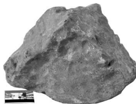
A „csátaljai” meteorit egyik jellemző alakot mutató irányból készült képe (méretarányának egy bankkártya van mellétéve)