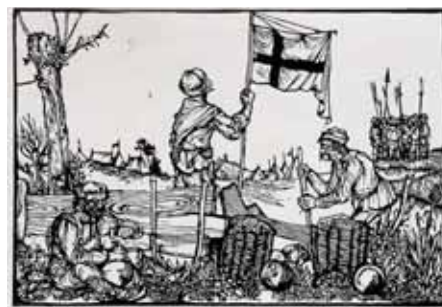
Gácsi Mihály Dózsa-sorozatából

A 20. század eleji alkotók közül mindenképp kiemelendő Derkovits Gyula (1894-1934) munkássága. A művész 12 részből álló Dózsa-fametszet-sorozata az illegális kommunista párt megbízásából készült 1928-ban. A sorozat feldolgozza a felkelés teljes történetét a gyülekezéstől a leveretésig és a megtorlásig. Derkovits parasztjai mind erőttől duzzadnak, hiszen a művésznek a forradalmi nép elsöprő erejét kellett ábrázolnia. Maga Dózsa két képen jelenik meg; az egyik a várfokon küzdő tántoríthatatlanul előrenyomuló népvézérként (aki egy jobbágyok közül), a másikon tüzes trónján is állhatatosan, megalázottságában is büszkén ülő alakként látjuk, akin szenvedésnek vagy félelemnek nyoma sem látszik. (Háttérbe húzódva két sötéten ábrázolt pap tűnik fel.) Az egy másik ké-