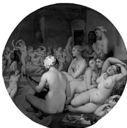
Jean Auguste Dominique Ingres Törökfürdő (1862)

A hamamokba a belépő 10 és 20 líra között váltakozik, ez a komplexum használatát foglalja magába, adnak hamam-kendőt (ha valaki nem akarna teljesen meztelenül fürödni) és törülközőt, papucsot, ha esetleg nem lenne. Ó, és ne felejtjük el, van koedukált hamam is Isztambulban, igaz, csak párok mehetnek be (Süleymaniye hamam). A testradír és a masszázs külön fizetendő, ebben a hamamban a teljes szolgáltatást 50 líráért adták. Összehasonlításképpen: a felkapott turista-hamamokban, amelyek persze gyönyörűek és hatalmasak (Cemberlitas hamam), már eleve 50-60 líra a belépő, és a teljes program akár 120-150 líra is lehet.