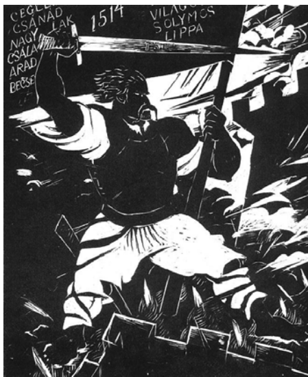
A népvész Dózsa Derkovits Gyula metszetén

A késő Kádár-korszakban, majd a rendszerváltás után a téma sokkal kevésbé volt középpontban; egy alapvetően konfliktuskerülő, a problémákat tárgyalásos úton rendezni kívánó időszakban a „népfelkelő” alakja háttérbe szorult. Viszont nem került azon alakok közé sem, akinek a szobrát ledöntötték vagy eltávolították, és azok közé sem, akikről elnevezett utcákat azonnal szükségesnek érezték átkeresztelni. A történészek azonban szép lassan elvégezték az események átértékelését, és talán Dózsa és mozgalma is lassan a helyére került. Néhány szélsőbaloldali és anarchista ideológuson kívül ma a többség belátja, hogy Dózsa parasztháborúja kétségkívül véres, ám hosszabb távú jelentőségét tekintve inkább marginális epizódja volt a magyar történelemnek, és annak vezéréből inkább propagandisztikus célokból lehetett példaképet vagy nemzeti hőst faragni.