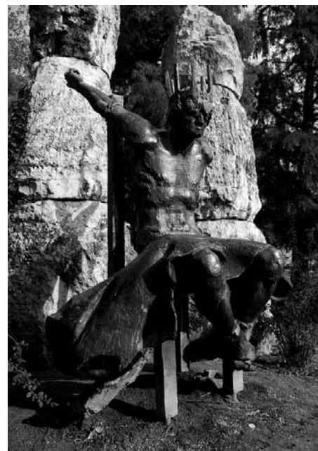
A mezőtúri Dózsa-émlékű