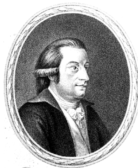
Zách Ferenc Xavér

Zách Ferenc Xavér (1754-1832) Pesten született, középiskolai tanulmányait hazájában fejezte be. Katonai pályára lépett, és Bécsben hadmérnöki képesítést szerzett. Érdeklődését a matematika és annak fizikai alkalmazásai keltették fel. Egyetemi tanári státusba került Lembergben, majd gróf Brühl szász nagykövet alkalmazásába lépve Londonba utazott. A gróf révén ismerkedett meg William Herschel amatőr csillagással, akit 1781-be az tett világhírűvé, hogy felfedezte a Naprendszer hetedik bolygóját, az Uránuszt. A sikeres asztronómus azonban eredeti foglalkozása szerint zenész, így a matematikában járatlan volt. A megfigyelésekbe is besegítő Zách végezte el azokat az első számításokat, melyekből következtetni lehet a bolygó pályaellipszisének méretére. A magyar mérnök csillagászati tevékenységére felfigyelt és tagjává is választotta a londoni Royal Society.