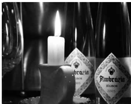
Az Ambrázia jégbor is több díjat nyert már

– Alkalomtól függ. Mostanában szívesen iszom a rozét, mert nagyon kellemesre sikerült, akárcsak a cserszegi fűszeress. Évtizedek óta mindig az étkezéshez társítom a borokat. A családjunkban nagyon is élő a gasztrokultúra. Nem tudnék meginni halászlére egy édes fehér bort, mert rosszul lennék tőle. Egy igazi jó pecsenyére se tudnék száraz vöröset inni. Olyan szerencsés helyzetben voltunk, hogy mindig volt borunk. Amikor a 70-es évek közepén Magyarországon elkezdődött a szakcsoporthoz szőlőtelepítés, én azonnal telepítettem, így volt saját borom. Folyamatosan látogattuk is egymást, szinte az ország összes borászat ismertem, hiszen mindenki Budafokon végzett. Akármelyik pincébe mentünk Tokajtól Sopronig vagy Nagykanizsától Egerig, mindig vittünk magunkkal bort ajándékba, és természetesen kaptunk is ajándék bort. Mindig van a pincémbe országos választék. Ha külföldön jártunk, onnan is hoztam