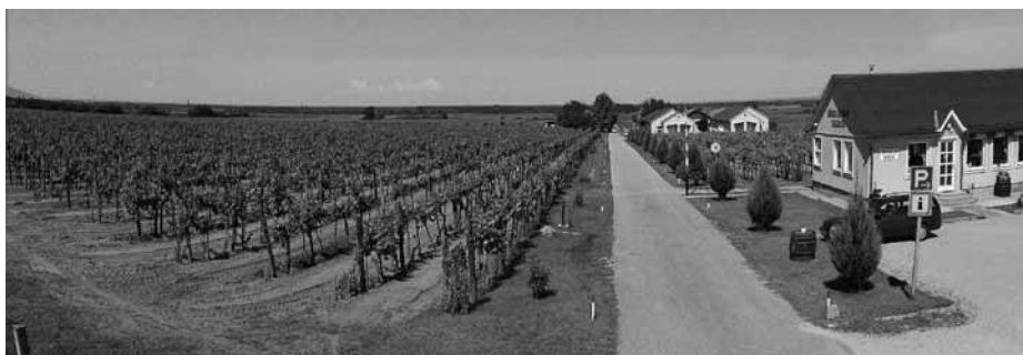
A szőlőtermesztés egész évben megfeszített munkát jelent

– Hogyan gondolkodnak a világban a magyar borról?