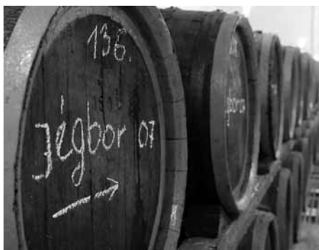
A jégbor készítése bizonytalan: ha nincs fagy, nincs bor

tett bemenni, mert a kadarkafürtök lelőgtak a homok fölé. A szüretet már nem szerettem annyira, mert mindig 22-23 cukorfokos kadarkát szüreteltünk. Édesapám hagyta túlérni, hogy jó legyen a minősége, és kellemetlenül ragadt az ujjamhoz. Jobban szerettem a pincében dolgozni.