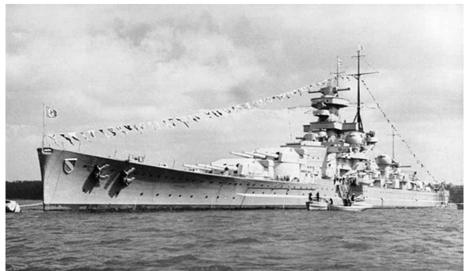
A Scharnhorst csatacirkáló

A náciq étvágyát felkeltő zsákmány ígértes: félmillió bruttó regisztertonnáyi kereskedelmi hajó. Csakhogy a konvojt három cirkáló is kíséri. Közülük a Norfolk régi ismerősünk. A Scharnhorst először kilenc órakor támadna dél-keleti irányból. Ám a britek radarkészülékei időben észle-