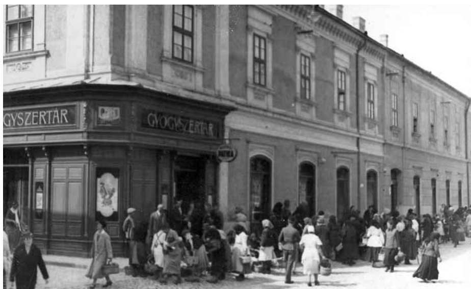
A Bajai Takarékpénztár épülete a Gyarmati-patikával (1925 körül)

Középiskolás korunkban már nem ebéd, hanem vacsora után mentünk sétálni fél órára (anya is), időszerű dolgokról beszélgetve. Egyik alkalommal ez volt a tanulság: Ha valakinek több van a fejében vagy a zsebében vagy mindkettőben, mint a nagy átlagnak,