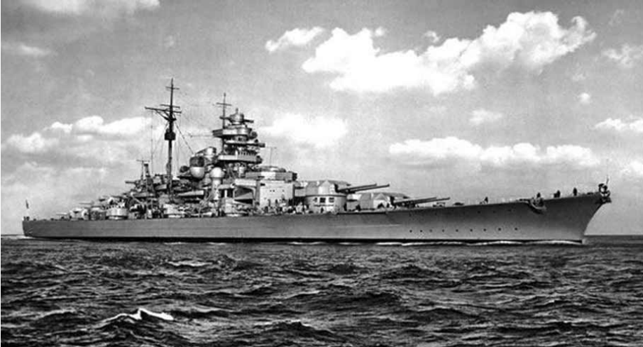
A Bismarck csatahajó

nyílt tengeren nem javítható. A Bismarck – bár hajtóművei sértetlenek – nem képes többé egyenes vonalú haladásra, az óceán tükre csak köröket szánthat. A menekülést ígérő francia partoktól nyolcszáz kilométerre, tehetetlenül, kiszolgáltatva várja üldözőit és bekövetkező végzetét.