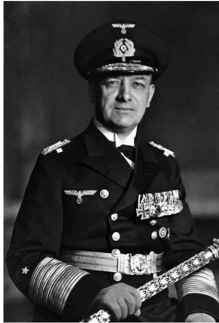
Erich Raeder vezértengernagy

Erich Raeder tapasztalt, a hadtörténetet jól ismerő admirális. Egyértelmű számára, hogy négy nagy vérteshajójával nem szállhat szembe a brit túlerővel nyílt tengeri csatában. Tisztában van azonban azzal, hogy a brit ipar a szénen kívül híjával van minden stratégiai nyersanyagban. Mezőgazdasági termelése csak a szigetlakók töredékének élelmezését fedezi. Albion számára tehát létérdek, hogy hatalmas kereskedelmi flot-