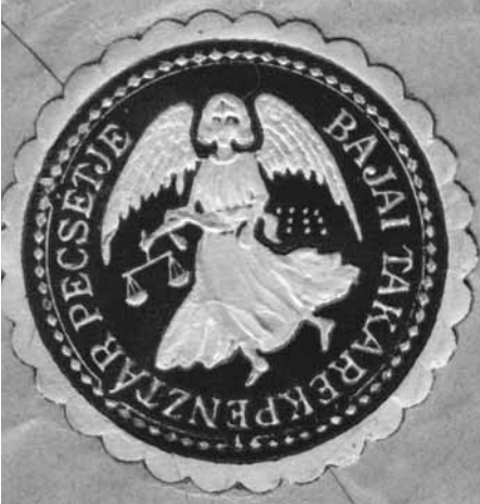
A Bajai Takarékpénztár pecsétje

Nemzeti Bank akkor létesített fiókja számára. Az emeleten lévő tiszviselőlakások, valamint a Bajai Takarékpénztár emeleti