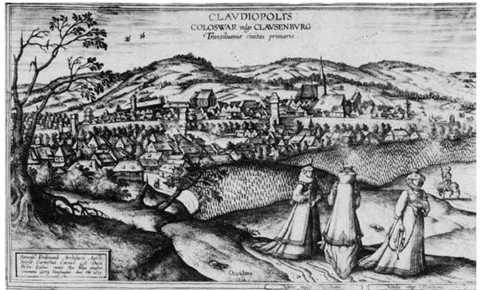
Kolozsvár a 17. században