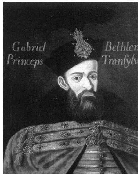
Bethlen Gábor, Erdély fejedelme

és falvakkal együtt, ráadásul úgy, hogy saját, vonakodó katonáit kellett kiostromolnia a várból. Emiatt a Habsburg-udvarban és Magyarországon is árulónak tekintették, de Erdélyben is sokan bírálták. Döntése azonban hosszú távon helyesnek bizonyult, hiszen nemcsak saját fejedelemiségét őrizte meg, de egy török támadás vagy hosszabb háború esélyét is elhárította.