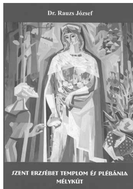
A címlapon Prokop Péter hármastájképéből a középső, Szent Erzsébetet ábrázoló festmény látható

Mélykúton már nem sokkal a 2. világháború vége után felmerült egy második templom és plébánia létesítésének gondolata, amelyet Kalocsán is indokoltnak tarthattak, hiszen már az 1950-es évek elejétől papot küldtek a Gányó- vagy Marschalltelepi hívek ellátására. A korabeli belpolitikai viszonyok kezdetben csak a Szent Tamás Egyháznak elnevezett helyi lelkesítés létrehozását tették lehetővé, az istentiszteleteket az ottani iskolában tartották. Az új templom építésének eseményei 1957 novemberétől kaptak igazi lendületet: a Grósz érsek megbízásából elkészített és az illetékes állami szerveknek betervezett tervek már 1958 nyarára meglettek a szükséges engedélyek. Előzőekkel párhuzamosan megvásárolták az építési telket és a példátlan összefogásnak (adakozások, célzott perselyezések, építési anyag szerzése helyi munkaerővel bontásból, fuvarok vállalása, az építkezés során folyamatosan munkászek biztosítása stb.) köszönhetően hamarosan megindulhattak a munkák. Már 1958 őszén álltak a falak, 1959-ben hozzáfogtak a plébánia és a torony építéséhez, 1961. július 16-án szentelték a templomot, ezt követően a beren-