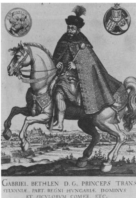
Bethlen Gábor hadai élén