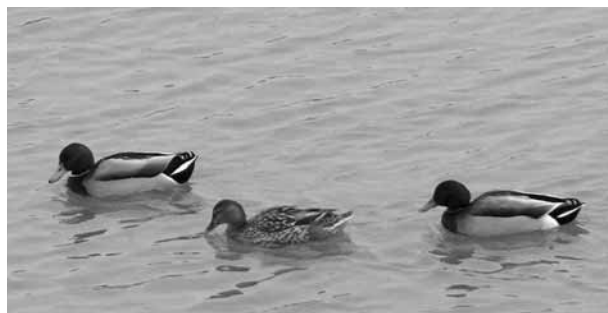
Tojót kísérő gácsérok

A tőkés réce döntően növényi eredetű táplálékokat fogyaszt, emellett nem veti meg a rovarokat, lárvákat, csigákat, ebiha-