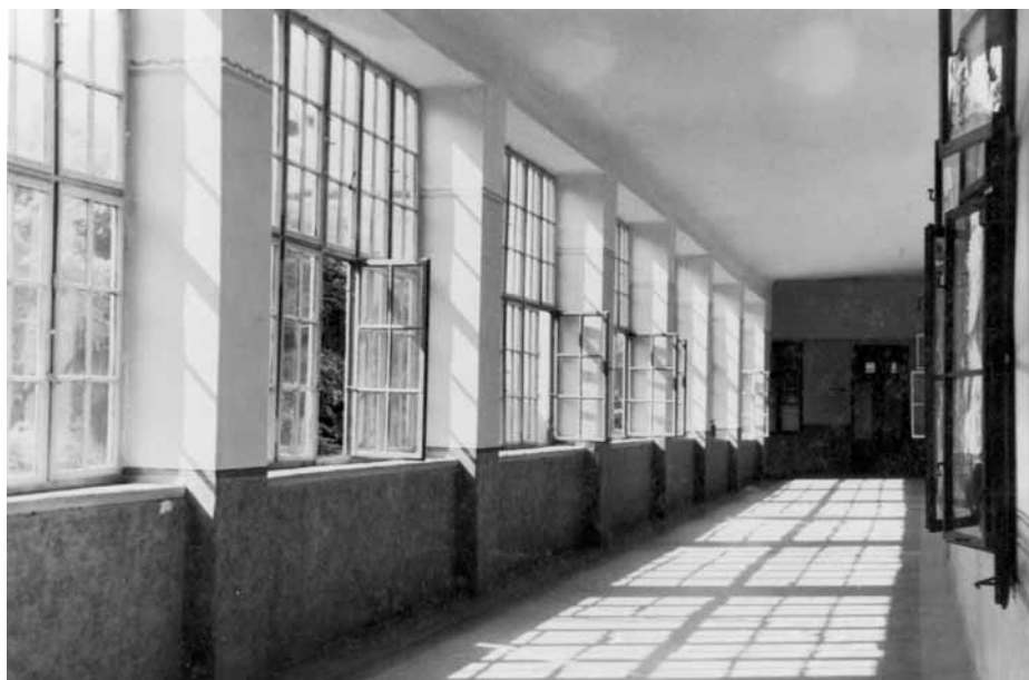
A Bajai Takarékpénztár emeleti folyosója (1930-as évek)

az felelős a többiekért! Ilyen gondolatok egy életre megmaradnak.