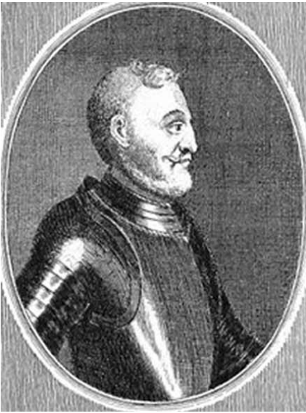
Báthory Gábor fejedelem

Ezzel megnyitotta az utat Báthory Gábor előtt, aki a hajdúkkal szövetséget kötve mindenáron fejedelem akart lenni, és ennek fejében felelőtlen ígéreteket is tett. Bethlen pedig az ő képviselőjében utazott Konstantinápolyba, hogy – korábbi összeköttetéseit kihasználva – megszerezze a portai jóváhagyást Báthory Gábor számára. Bethlen e küldetést sikerrel teljesítette, és nemcsak a szultáni athnamét hozta magával, de a tartomány háromévi adómentességét is ki tudta harcolni. A fiatal fejedelem ekkor nem is maradt hálátlan: Bethlen tanácsos, az udvari hadak főkapitánya, Hunyad vármegye főispánja, Csík-Gyergyó-Kászon szék főkapitánya lett, birtokait is gyarapíthatta, és török kapcsolata miatt a fejedelem elsősorban főképp diplomáciai szolgálataira tartott igényt.