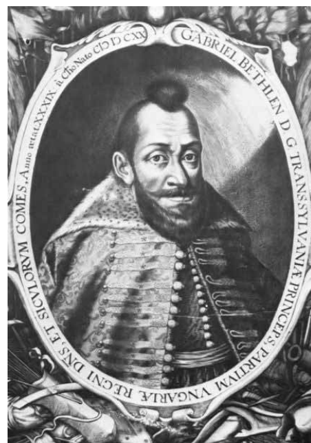
Bethlen java férfikorában

Hogy az erdélyi kortársakban nem ébresztett azonnal bizalmat, abban hatalomra kerülése mellett külső megjelenése és modora is szerepet játszhatott. A jóképű Báthory Gábornál csak néhány évvel volt idősebb, de zömökebb termetű volt, ráadásul ifjúkori harci sebesülései miatt mozgása is kissé merev volt; szakállas, sötét arca inkább taszította a hozzá közeledőket. Kevés igazi barátja akadt; inkább tisztelői voltak,