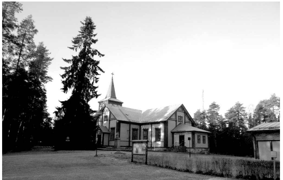
A sievi templom

No, persze ismét csak hivatkozom a vesszőparipámra, imamalmomra, papagáj-ismételgetésemre: Füst Milán mondja: „Semmi sincs egészen úgy”... A magyarok közül se mindenik lop, csal, hazudik, és a finn se mind tiszta, becsületes. Ez tény. De