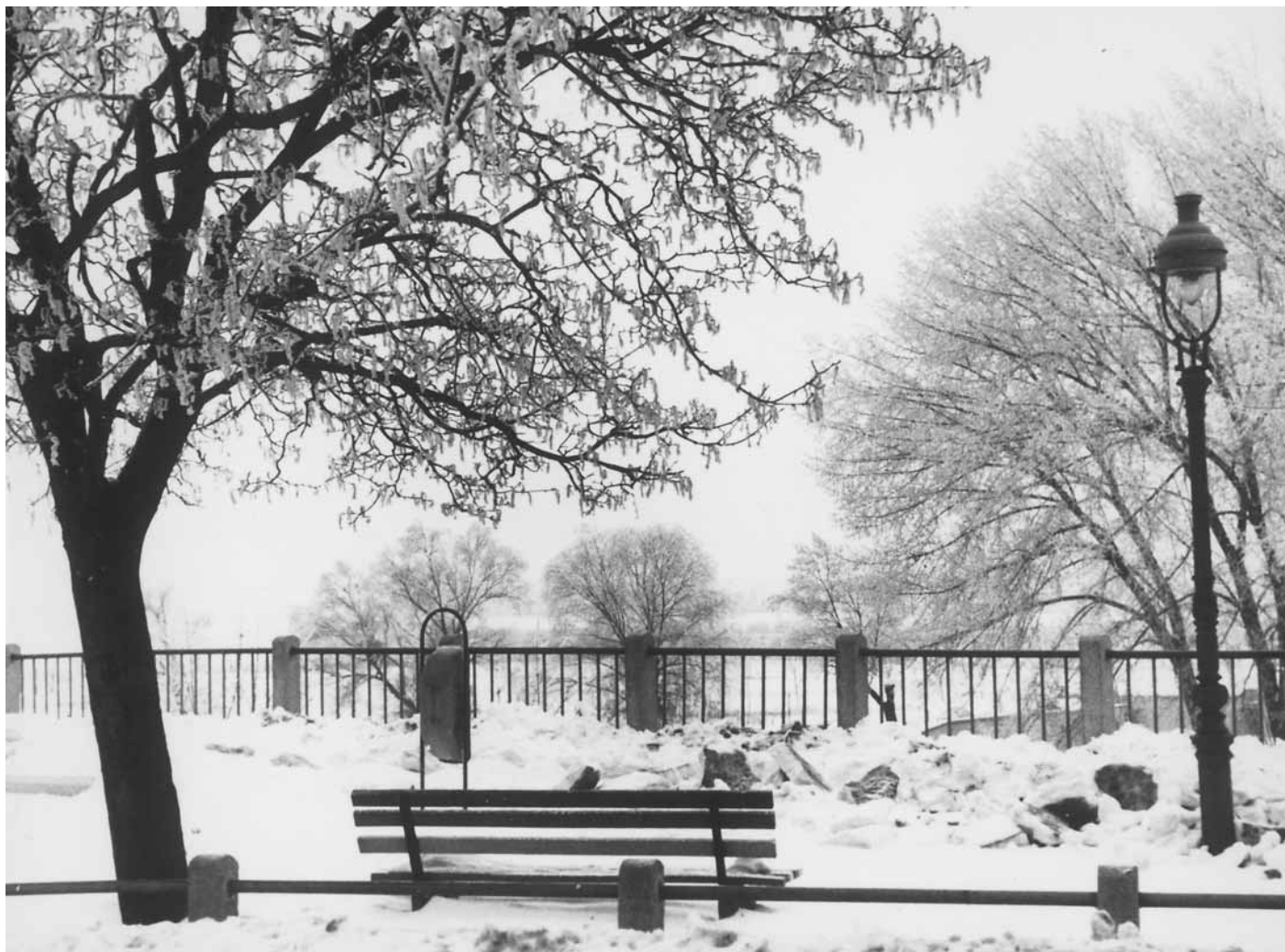
Tél, 1964