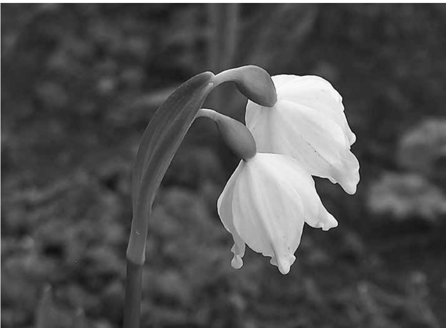
Közelkép a virág lepelleveleiről