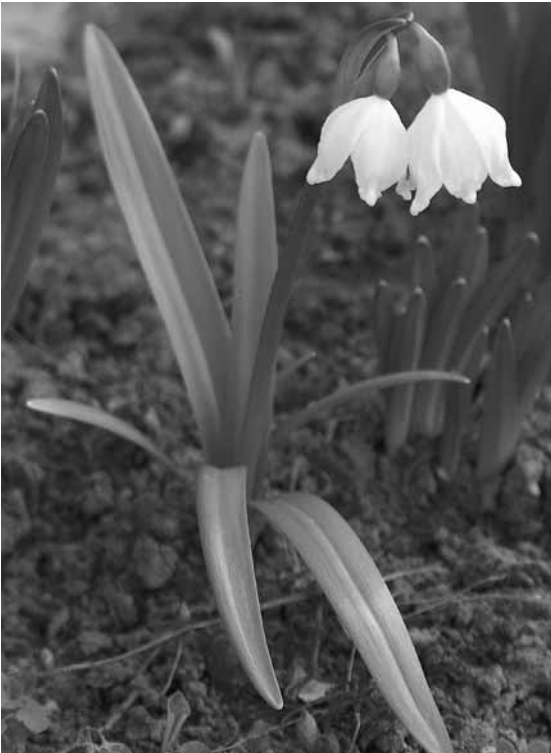
A Babits Mihály utcai virágágyások egyik korai ékessége a tavaszi tőzike

Az amarilliszfélék (Amaryllidaceae) családjába tartozó tavaszi tőzike természetes környezetben a nedves réteken és ligeterdőkben, a patakok szegélyében, valamint a bükkkel és gyertyánnal tarkított erdőkben található meg. A növény legjelentősebb hazai állományai Dunántúl nyugati részén, közvetlenül a Budapest alatti Duna-szakasz mentén és a Beregi-Tiszahát vidékén lelhetők fel. A Kárpát-medencén kívül Európa nyugati felén is meghonosodott, de minden-