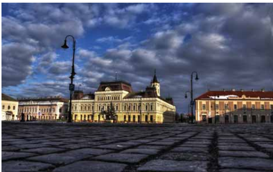
Ligeti László: A tér