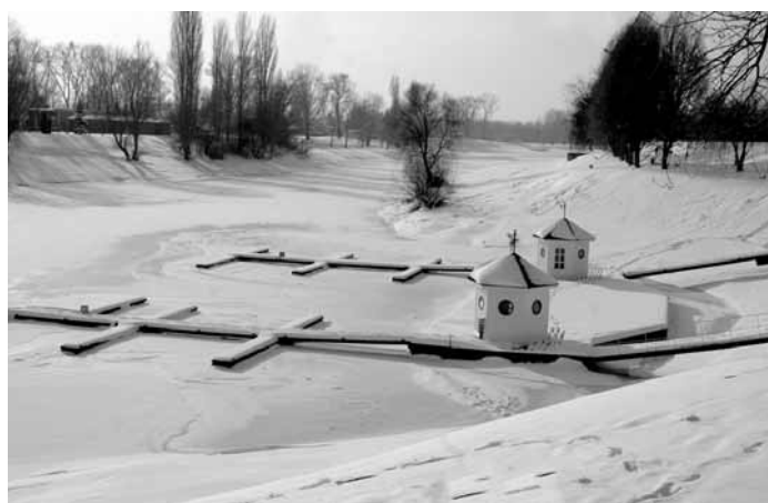
Ligeti László: Fehér táj