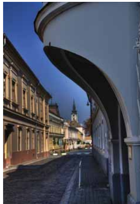
Ligeti László: Vasárnap reggel