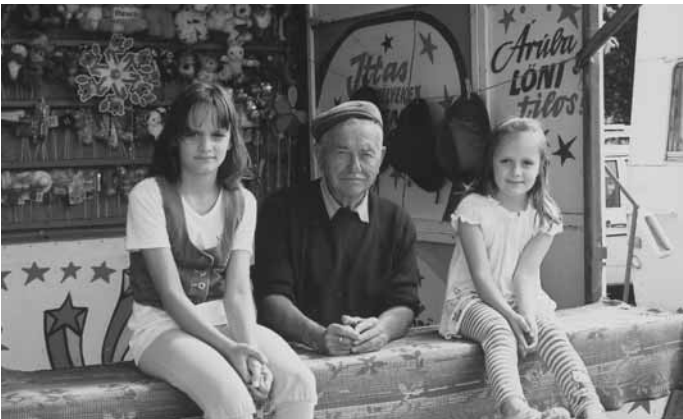
A 2011. évi felsőszevntíváni búcsúban. A Prehalek házaspár a szerző unokáival