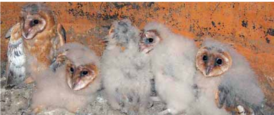
A tollazat alapján néhány napos különbséggel világra jött, a gyűrűzésen már átesett fiókák