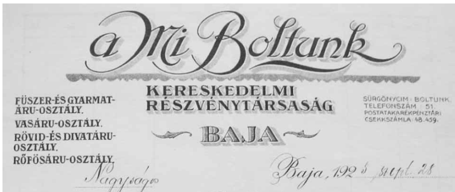
A cég szép kiállítású levélpapíra

Nem csak a bajaiak vásároltak itt. Ez derült ki egy kérvényből, amikor a vásárnapi munkaszünetet szerették volna bevezetni (A törvény szerint a két világháború között a helyi iparhatóság megadhatta a vásárnapi munkaszünetet, ha a kereskedők kétharmada kérte.) A Mi Boltunk Rt. Igazgatósága azért nem írta alá a kérvényt, mert „a városnak fontos gazdasági érdeke fűződik ahhoz, hogy az üzletek vásárnap nyitva legyenek. A szomszédos községek lakosságának nagy része csak vásárnap jöhet be bevásárolni, mivel a munkanapokon el van foglalva s ily módon a bajai kereskedők elég tekintélyes számu vásárló közönségtől esnek el.”