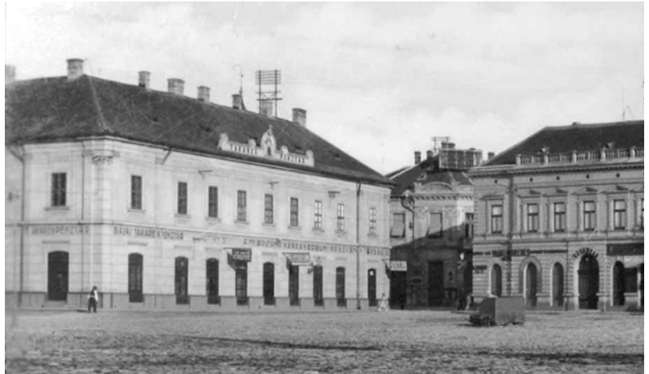
A Takarékpénztár épületének főterei szárnya, amelyben a Mi Boltunk működött