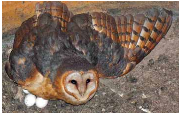
Tojásokon ülő tojó Ez a példány a Magyarországon legjellemzőbb sárgás, vörösés mellű alfajhoz tartozik

A madár legismertebb népi nevei Kelemen Attila feljegyzése szerint ( Madaraskönyv , Bukarest, 1978.) lángbagoly, fátyolos bagoly, visító bagoly, toronyi bagoly és gyöngyös bagoly. Angol neve Barn owl, azaz csűrbagoly, németül ugyanez Schleiereule vagy Kircheneule, magyarul fátyolos vagy templomi bagoly. Az elnevezések alapja a