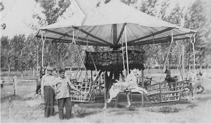
Régi-régi, gyermekek által hajtott körhinta