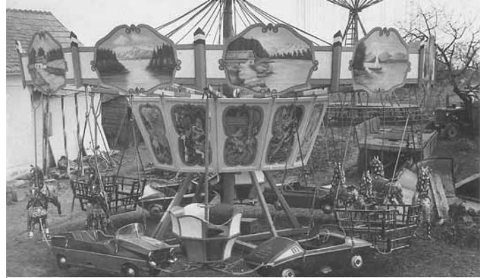
Motoros körhinta, ma már múzeumi darab