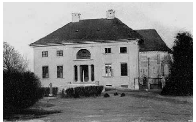
A Rédl-kastély a 20. század elején, jobb oldalon jól látszik az egybeépített kápolna

fia 1780-ban az 5308 magyar hold kiterjedésű Rasztinapusztát kapta meg. A család emelkedése tovább tartott, mert az ő fiai (Imre és Gyula) 1808-ban magyar bárói rangot, 1822-ben második előnévként pedig a rasztinait kapták. A 19. század elején báró Rédl Gyula építtette a rasztinai kastélyt, amelynek érdekessége, hogy kápolnával épült egybe.