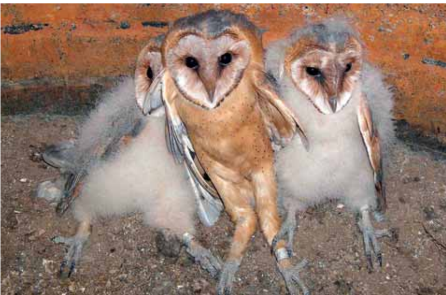
Ülő fiókák, jól kitűnnek a közepső madár hosszú lábai