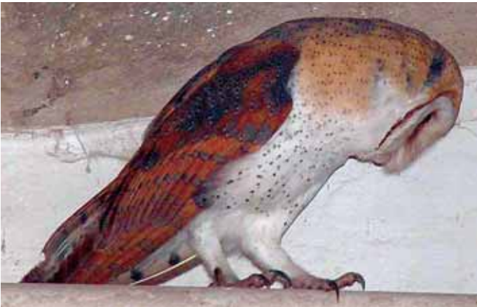
Egy, a fehér mellével a faj törzsalakjának jellegzetességét mutató gyöngybagoly pihenés közben egy lakatlan épületben Baja környékén. Jól megfigyelhetők a madár tühegyes karmai.