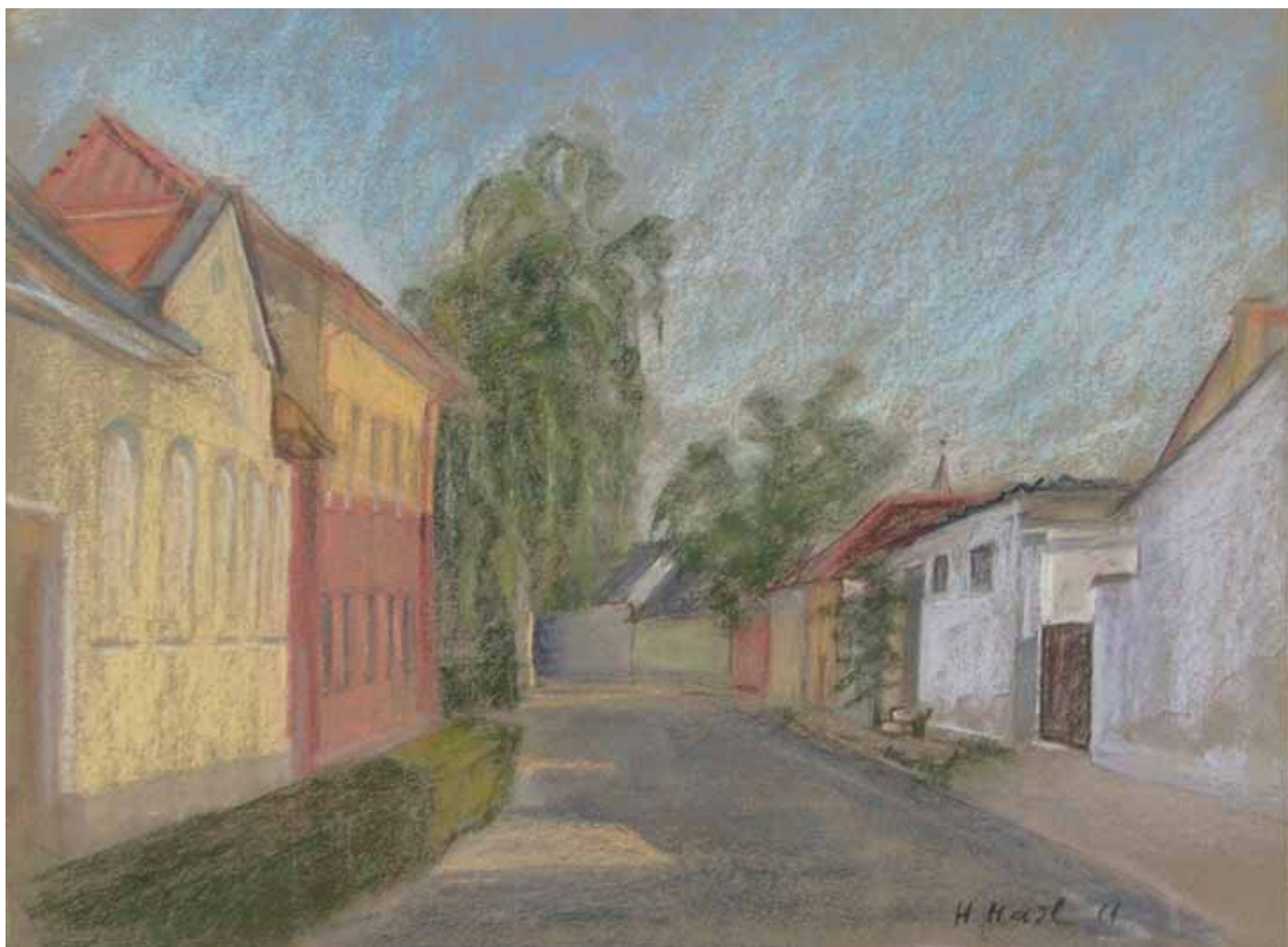
Gonds Hildegard: Reggeli hangulat a Kígyó utcában