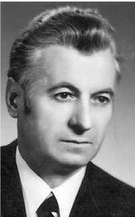
Az energikus fiatal vezető

Sándor nagy tantestületet és iskolát irányított kiváló szakmai sikerrel és emberi