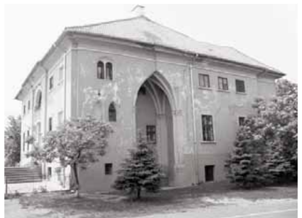
A rasztinai kastély napjainkban, a lebontott kápolna helyével