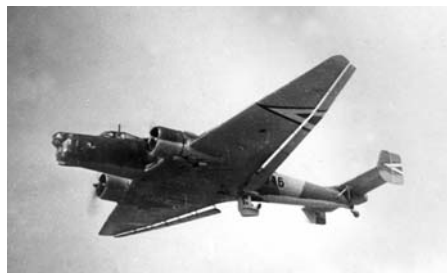
JU-86-os magyar repülőgép

Másnap reggelre már ismertté vált, hogy az ellenség hozzálátott az erődök kiürítéséhez is. A hadseregparancsnok ennek ellenére csak az eredeti tervnek megfelelően, azaz csak a tüzérségi és légi előkészítést követően engedélyezte a támadást. Az előkészítés azonban csaknem értelmetlen volt: a célba vett erődökben nem volt már ellenség, ráadásul a repülőgépek egy része (a JU-86-os bombázó osztály) az erődök helyett részben saját csapatait bombázta; szerencsére senki sem sérült meg, mert a betonromboló bombák gyújtószerkezetei a nagy sárban nem léptek működésbe.