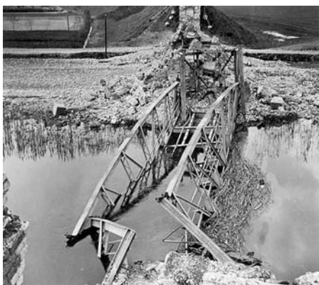
Felrobbantott híd a Ferenc-csatornán

Április 14-én már a Duna-Tisza közének teljes megszállása volt a cél, ami a gyakorlatban annyit jelentett, hogy birtokba kell venni az eddig el nem foglalt területeket, és a haderőt ennek megfelelően kell átcsoportosítani. Az ellenség szétverésének befeje-