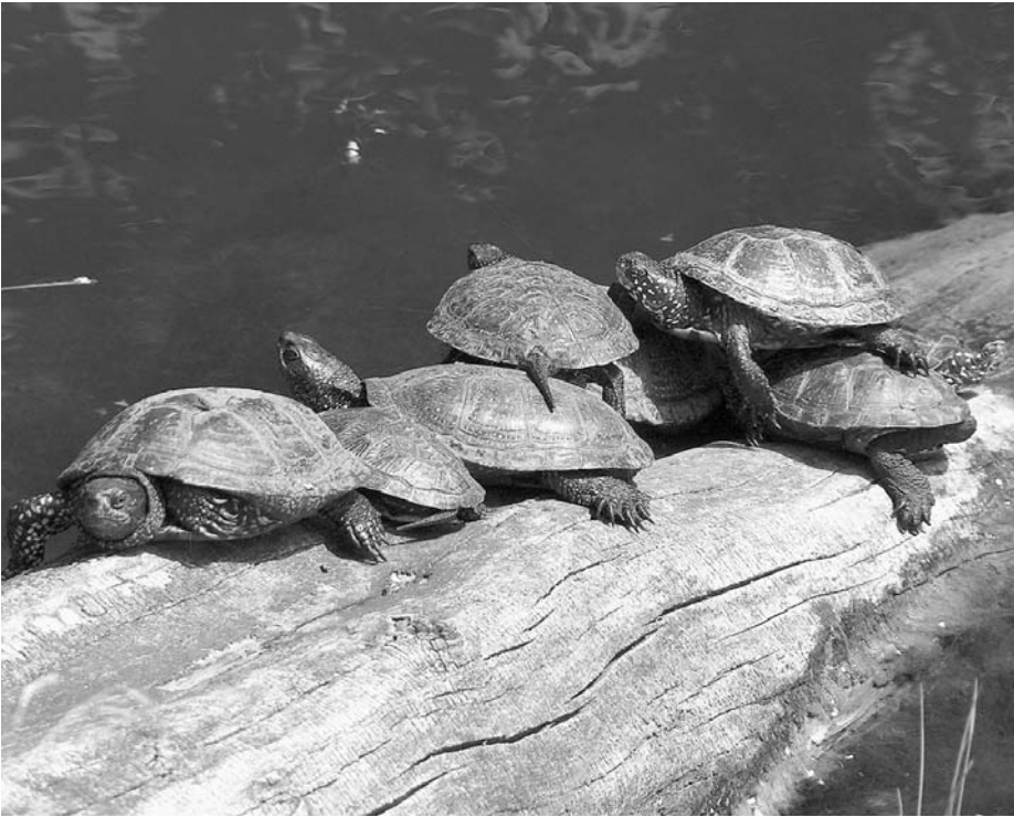
A mocsári teknős Baja környezetében még sokféle, de egyre gyérülő számban található. A Gólyasor előtti tavat mostanában például feltöltik, az élőhely megszűnik. Vajon mi lesz az ottani teknősökkel?

Szakközépiskolájának Oktatóbázisán néhány évvel ezelőtt monitoring jellegű munkát. Idén tavasz óta a WWF által indított országos programhoz a Magyar Madártani Egyesület is csatlakozott. A két szervezet e témával foglalkozó szakemberei átdolgozták a korábbi években használt