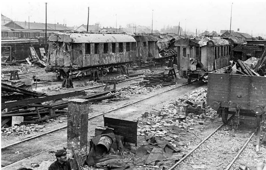
A szabadkai pályaudvar a tűzharok után

bor, Zenta, Újvidék stb.) – jelentős csetnik ellenállással is számolni kellett. A csetnik a felderítőekkel és a településekre bevonuló magyar főerőkkel általában nem bocsátkoztak harcra, és napközben mint békés polgárok jelentek meg az utcákon. Aztán sötétedés után rendszerint megbeszélte a jelre elfoglalt rejtett tüzelőállásait, és rövid, de hatásos tűzcsepást mértek a megszállókra. Ezt követően többnyire ismét szétszéledtek. Ezeknek a rendszeres, de jól szervezett támadásoknak főképp morális jelentősége volt: egyetlen idegen katona sem érezhette magát biztonságban a településen, hiszen pánikkeltés és megfélemlítés céljából minden be- és kivonuló csoportra tüzet nyithattak. Emiatt a már megszállt városokban is újra meg újra fellángoltak a harcok.