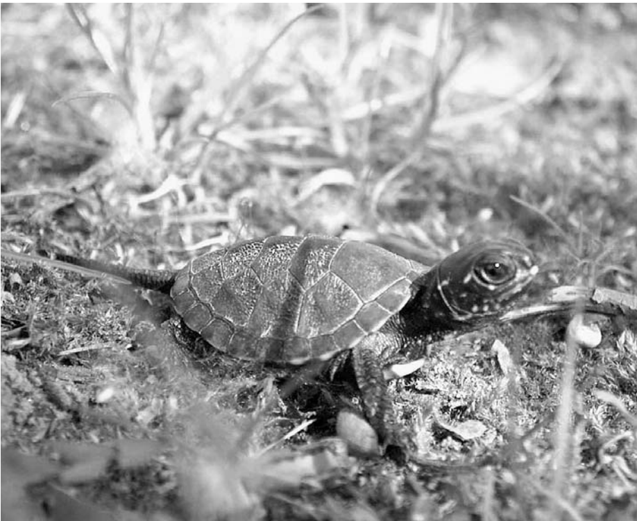
A tojásból előbújó, nagyjából dió nagyságú utódok szülei kicsinyített másai

A hobbiállatok árusításával foglalkozó üzletekben megvásárolható az a vörösfülű ékszerteknős, amelynek eredeti hazája Észak-Amerika. Kiskorukban a család kedvencei, majd a terráriumot kinőtt pél-