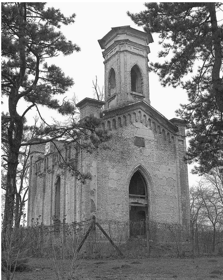
A romossá vált kápolna 2006 elején. A drótkerítés az omlásveszélyre figyelmeztet