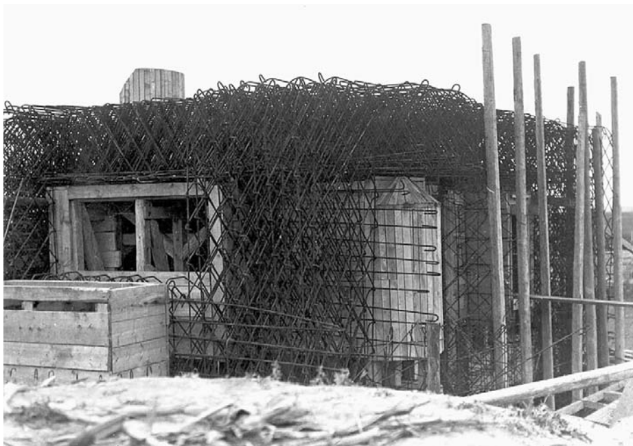
Jugoszláv határvédelmi erőd

A magyar haditerv már a gyors német sikerekből indult ki, hiszen április 10-én a németek már Belgrádot támadták. Ezért a magyar támadás időpontját 24 órával előbbre hozták, és végül április 11-ére tűzték ki. A terv lényege a következő volt: a hadsereg a IV. és I. hadtestekkel (az V. biztosítása mellett) Őrszállás térségében áttöri a jugoszláv erődöt, birtokba veszi a Ferenc-csatorna hídjait, majd a gyorshadtest ütközetbe vetésével kifejleszti a sikert. Újvidéknél az elől támadó gyorshadtest kijut a Dunához, és befejezi a jugoszláv erők bekerítését. Ezek után valamennyi erő bevonásával kezdi meg az ellenség megsemmisítését. Az őrházak elleni támadás 11-én délután, az erődív elleni tüzérségi előkészítés eredetileg másnap 8 órakor, az erődív megtámadása pedig 12-én 10 órakor kezdődött volna.