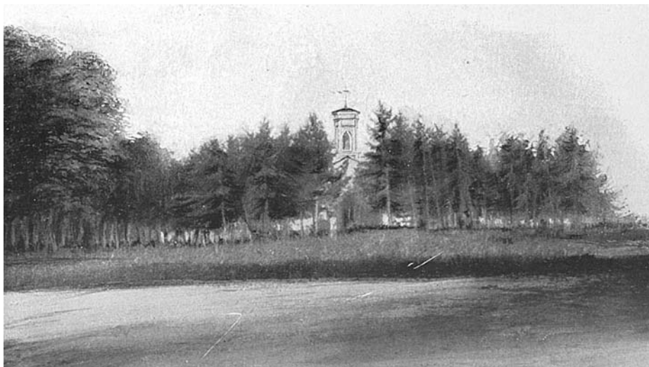
A környező kis erdőben rejtőző temetkezési kápolna az 1900-as évek elején