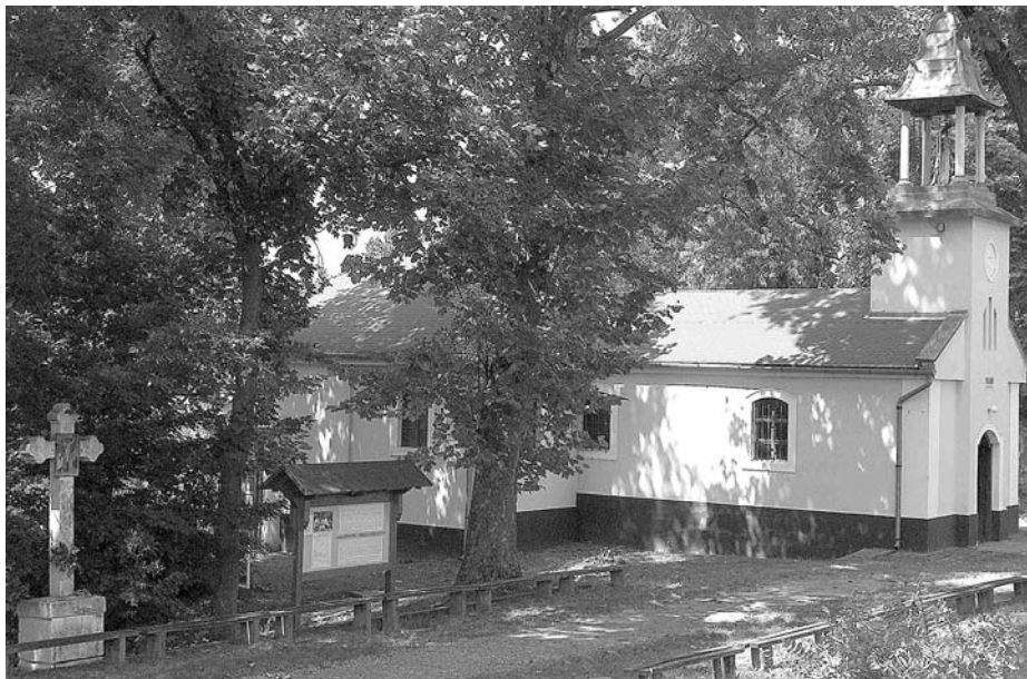
A kegyhely történetét bemutató tábla a vodica-i kápolna mellett

tek támogatásával, illetve önkéntesek adományainak köszönhető példátlan összefogás eredményeképpen nemcsak felújítás