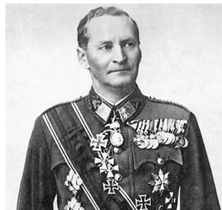
Dálnoki Miklós Béla, a Gyorshadtest parancsnoka

Magyar részről a hadjáratban a korábban a délvidéki határokon készenlétbe helyezett négy magyar hadtestből létrehozott 3. Magyar Hadsereg (parancsnoka Gorondy-Novák Elemér tábornok), valamint a Fővezérség közvetlen alakulatai vettek részt. Döntő többségüket három hadtest, valamint a 19. dandár gyalogsága tette ki. Ez összesen 20 gyalogezredet, három közel-felderítő repülőszázadot, két kerékpáros zászlóaljot és egy önálló huszárszázadot jelentett. Részt vett még a hadjáratban a magyar királyi honvédség legkorszerűbb seregteste, a gyorshadtest is, amelyet Dálnoki Miklós Béla tábornok parancsnokolt. Ez utóbbi két gépkocsizó dandárból, két lovasdandárból és egy közelfelderítő repülőszázadból állt. A tüzérség a dandárok egyes tüzérezredeiből, valamint a hadtestek tüzérsztyályaiból tevődött össze. A magyar légiereő részéről 84 vadász, 68 bombázó, 24 távolfelderítő és 6 szállítógép volt bevethető, ami önmagában nagyon kevés lett volna, ám hiányosságait pótolták a hazánkba telepített német vadász- és bombázóosztályok. Horthy hadiparancsa szerint a magyar csapatoknak csak az ország régi határáig kellett előrenyomulniuk.