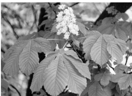
A vadgesztenye virágzata és levelei