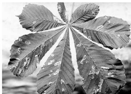
Jól látszanak a molylepkék aknái