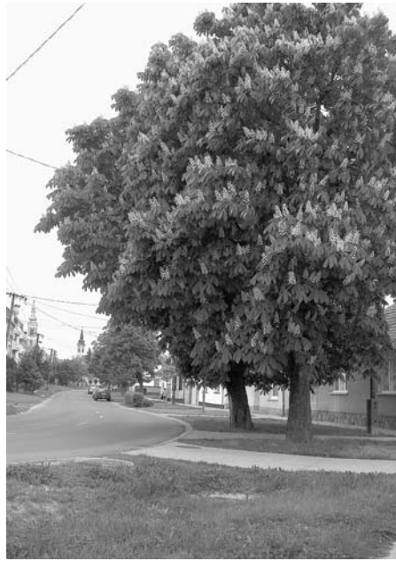
Összenőtt koronájú gesztenyefák a Deszkás utcában

Az 1911-ben kiadott Révai Nagylexikon Bajára vonatkozó szócikkében olvasható: „A közelben nyíló Szt. Antal-utca a város legszebb utcája.” Részletes magyarázatot Major Máté „Egy gyermekkor és egy kisváros emléke” című, 1973-ban megjelent könyvében találunk. „... legszebb azonban a szűkebb, belvárosi utcaszakasz két régi fasora volt; ezeket még a XIX. században ültették, éspedig úgy, hogy az akácok és platánok váltogatták egymást. ... De még a kisgyerek is észrevette, a gyerekszerelmek korában különösen, amikor úgy május-júniusban egyszerre kivirágzott az akác, és mézédés illatát könnyű szelek hátán végig-hömpölygette a lombbal zárt utcamederben. Az illathullámok ilyenkor át-átesaptak a házak tetőgerince felett, és elárasztották az udvarokat is. Ezeket a gyönyörű fákat valamikor a húszas évek végén vagy a harmincasok elején egytől egyig kivágták, s a helyükre újat ültettek”. A leírás 1960-as évek végére vonatkozó részlete: „A platánok és akácok helyére ültetett gesztenyefák alaposan megnöttek, összeérő koronáikkal az egykori lomboltozatot kezdik utánozni, gyökereikkel pedig éppúgy emelgetik a régi hatszögletű téglával burkolt, ismét hullámos, gödrös, s itt-ott széteső járdákat, mint elődjük”. A folytatás mai eredményét mindannyian láthatjuk.