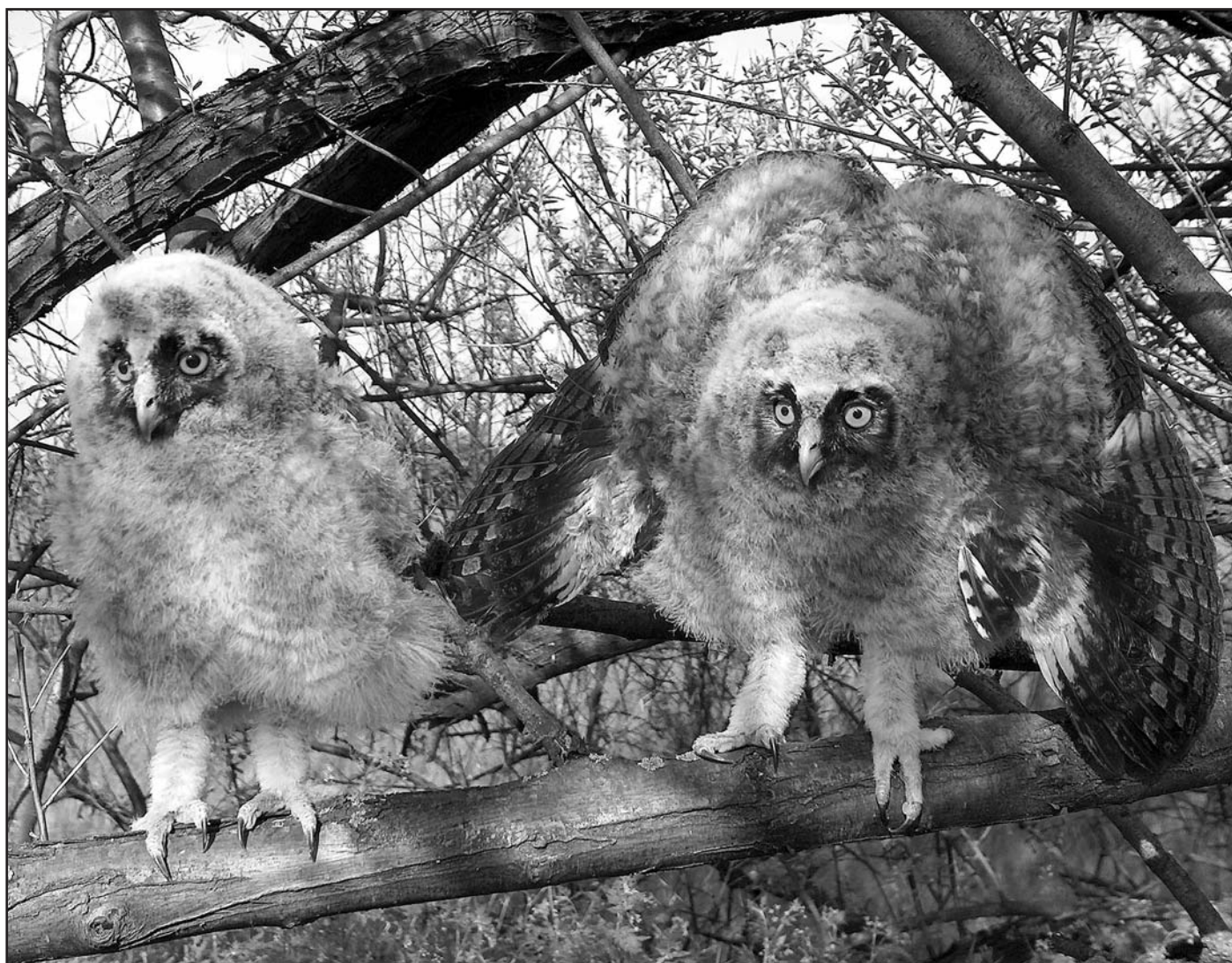
Tollasodó erdei fülesbagoly fiókák