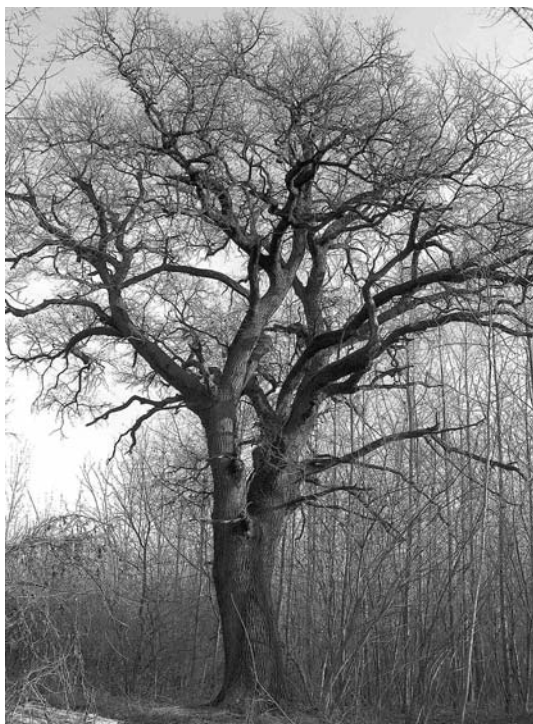
Régmúlt idők tanúja: idős kocsányos tölgy Gemencen

elterülő és a közelmúltban fennállásának tízéves évfordulóját ünneplő Duna-Dráva Nemzeti Park. A szervezeti változások nyomán 1977-ben létrejött az Országos Környezet- és Természetvédelmi Hivatal,