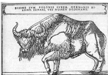
A bölény. A latin nyelvű felirat magyarul a következő: Én vagyok a Bisons, a lengyeleknél Suber, a németeknél Bisont, a tudatlanok az Urus névvel jelölének.

ró Heberstain Zsigmond német császári követ, aki 1571-ben megjelent munkájában közölte az őstulok és a bölény fametszeti rajzát. A képalírásokból kitűnik, hogy a két állatot abban a korban gyakran összetévesztették.