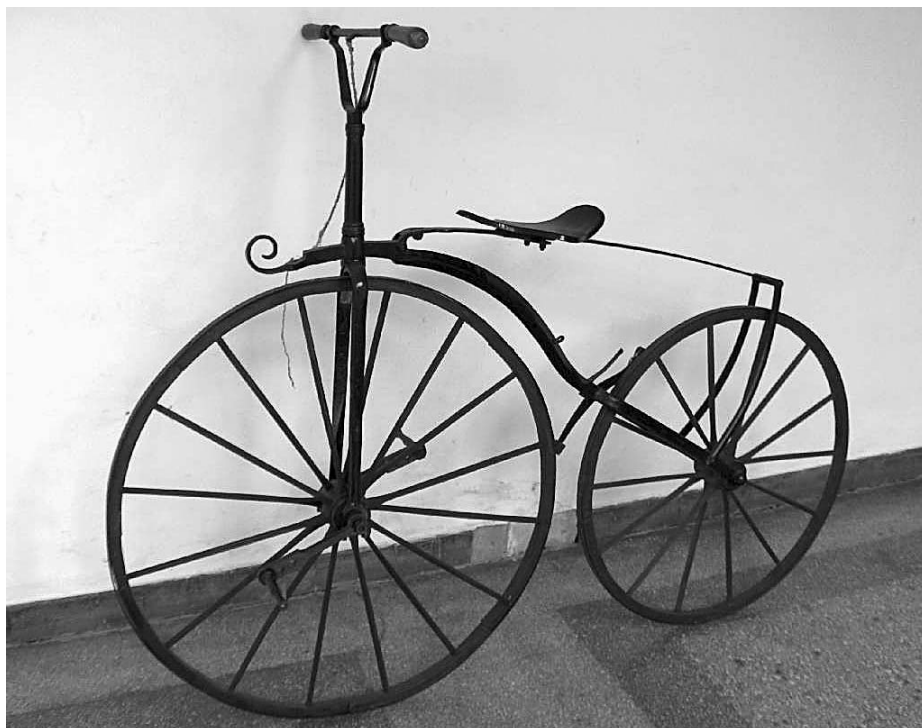
Az 1880-as években készült velocipéd

Az újítások folytatódtak, ezek közé tartozik a golyóscsapágy és a sárhányó, a fahelyett acélküllőket alkalmaztak, a kerekekre tömör gumit szereltek. Létrejött a teljesen fémből készült velocipéd. Ezzel már kétszer olyan gyorsan lehetett menni, mint egy „hagyományos kerékpárral”. A másfél méteres kerékméret azonban az emberi láb nyújthatatlansága miatt nem tudták átlépni. Angliában 1877-ben már 50 000 velocipéd volt forgalomban átlagosan 135 cm kerékméretével.