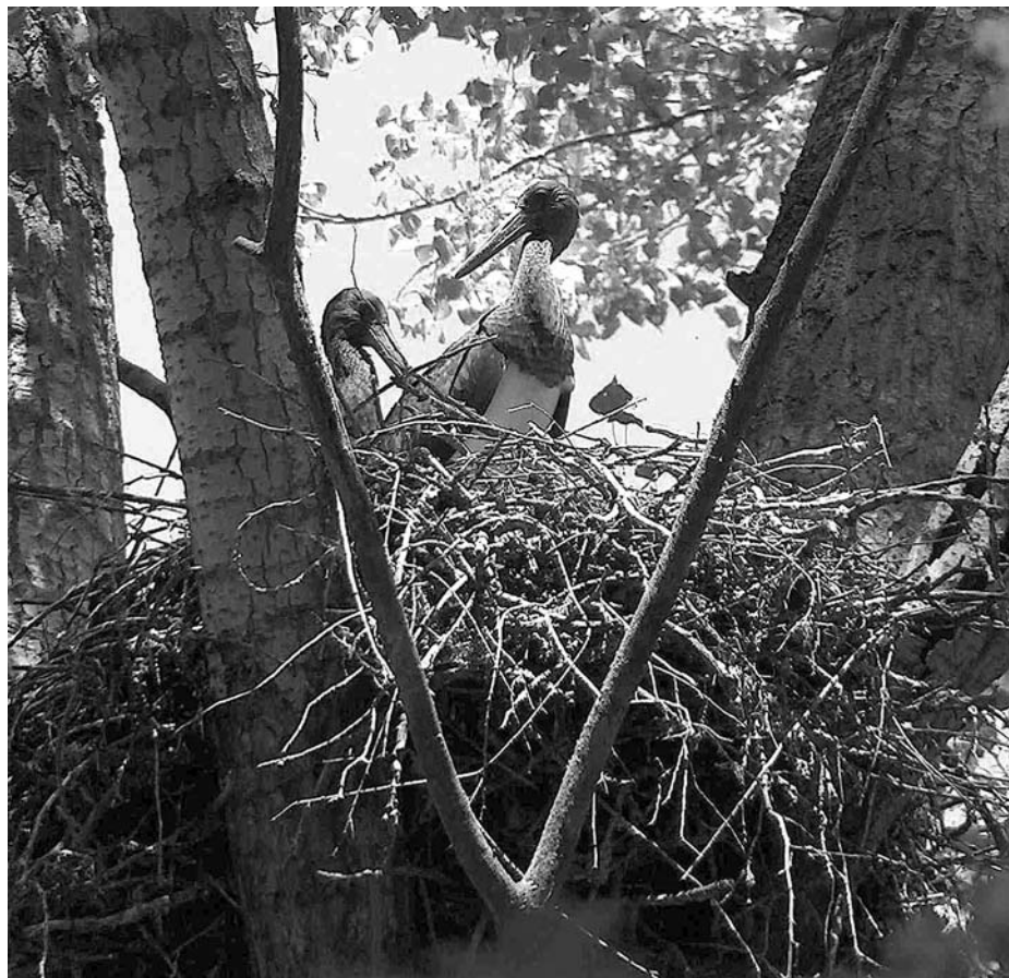
A Baja melletti erdők továbbra is a fekete gólyák költőhelyei

IV. törvénycikk). A megfogalmazott célok most is érvényesek: „A természetvédelem célja egyfelől minden olyan behatást elhárítani, amely a védelem tárgyának eredeti épségében való fennmaradását, illetőleg tájképi szépségét vagy egyéb sajátos természeti tulajdonságait sértené vagy veszélyeztetné; másfelől lehetővé tenni a védelem alá vont állat- és növényfaj zavartalan tenyésztését; megóvni a védett forrás és patak vizének tisztaságát és biztosítani a forrásokat a vadon tenyésző állatok számára”. A Földművelésügyi Minisztérium természetvédelmi hatósági jogkört kapott és tanácsadó, javaslattevő testületként létrejött az Országos Természetvédelmi Tanács. Utóbbi első természetvédelmi területünként a debreceni Nagyerdőt jelölte ki. Az 1949-ben döntési jogkört kapó Természetvédelmi Tanács 1950 és 1961 között 135 természeti értéket nyilvánított védetté hazánkban. Első tájvédelmi körzetünk a Tihanyi-félsziget lett 1952-ben. Az erdőkről 1961-ben újabb törvény rendelkezett, majd 1962-ben törvényerejű rendelettel létrehozták az Országos Természetvédelmi Hivatalt. A hazaiak közül elsőként, 1973-ban megalakított Hortobágyi Nemzeti Parkot napjainkra még kilenc újabb követte. Közülük nekünk, bajaiaknak minden bizonnyal legkedvesebb a városunk mellett