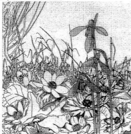
Tóth Pál grafikája