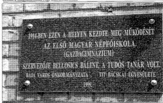
Emléktáblát avattak április 27-én a Bajaszentistváni Iskola falán

Miért is jó dolog festéssel foglalkozni? Többek között azért, mert festeni lehet akkor is, amikor hávós és esős idő van, ha meg vagyunk hívva, ha áradnak vagy apadnak a folyók, vagy éppen semmi mások nincs kedvünk. A többi maradjon titok.