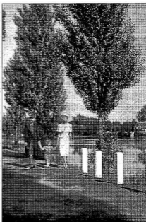
Séta a Szentjánosí úton 1941-ben nagyvíznél