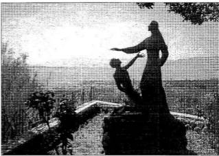
Krisztus és Péter apostol szobra a Genezaréi tó partján a Talhanánál

Egy turistacsoportnak megvan a maga békéje és biztonsága. Érthető, hogy a programkörülymetet olajozottan működik. De Izrael ettől függetlenül is nagyon működik. Eszrevehetően. Fegyelmeltzen, nagy bizalommal és erős demokráciával veszi körül nemcsak a turistákat, de lakóit is. Nem szeretnék most a lakóhelyzetéről, a fizetésekéről, szociálpolitikai kérdésekről vagy éppen a katonaságról beszélni. Egy nagyon egyszerű példát hoznék csak fel.