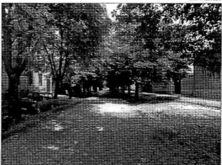
Szt. Antal utca anno 1976.