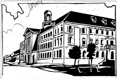
A várnegyzei színházaja Baján /Éber Sándor rajza/