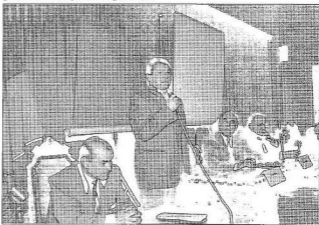
Fül-, orr- és gégeszakorvos tudományos ülésének megnyitója