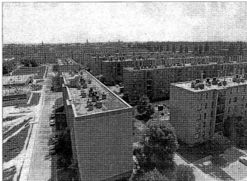
Baja Város a fonákjáról