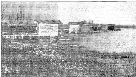
Szép vagy csúnya? A bécsbokodi horgászto

Mékközlelés, lassú folyamat. Erybe, szép, melengető napsütést kíván. Pusztító viharok letörnek az igéretes, zsenge kalászatokat. Önünk kell őket, ahogyan emberi erővel óvni tudjuk. Azért igyekeztünk a régi, békeséges idők módján, nyugodtan gondolkodni ilyen esztendőben is a nevelés, az iskola kérdéseiről, s ezért ragaszkodunk a nevelés örök eszményeinek, az élet idők feletti értékeinek tiszteléséhez." Nélkül időkben világos szavak ezek.