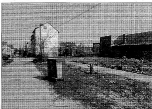
A régi után, az új előtt

– Az egyetemen eközben hogy boldogultál?