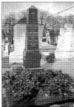
A bajjai Vojnits család sírja a bajai temetőben

kájának azonban nem ez volt a lényege. Amikor bizonyos kormánybírók erőszakosabb fellépésre ösztönöztek, így válaszolt: " Célm volt, mennyire lehet, vérontás nélkül a dolgot kiegyenlíteni, jól tudván azt: hogy fegyverrel valamely lázadást elnyomni lehet ugyan, de ezen úton barátokat szerzeni nem ". A Délvidék Janus-kapuját Csernovits nem holttestek átlépve kívánta becsukni. Tudta, s erre szerb ellenfeleit is figyelmeztette, hogy nekünk még sokáig együtt kell élnünk; a véres testvérharc nem üszekető kapocs, hanem a két nép szimbólizálásnak súlyos tehetőle lesz. Ezért kereste a megbékélés minden lehetőségét a szerb felkelőkkel. Ezért élt — az emberlélés