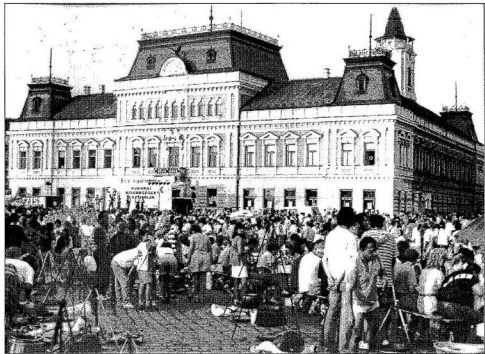
Az idei haltrézfűzés is jól sikerült