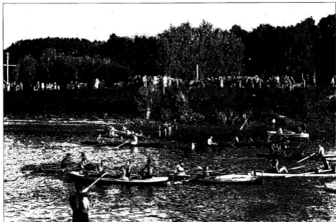
VÍZIELET A 30-AS ÉVEKBE