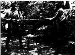
PUSKATISZTÍTÁS AZ ELSŐ HÁBORÚBAN