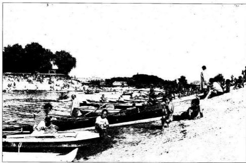
VÍZIÉLET A SUGOVICÁN 1936-BAN