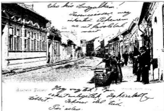
BECHERER KÁROLY GYŰJTEMÉNYÉBŐL