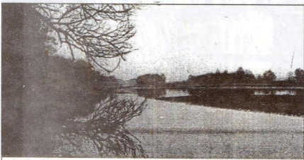
A Kádár-szigeti holtág

— Csak a műholdas vétel költségei hátríthatók át a társulati tagokra, azaz a lakosságra. A városi televíziót a tanácsnak illetve a városi önkormányzatnak kell fedeznie. A szolgáltatásokat az érdekeltek fizetik, a városkörnyéki televíziózás pedig a községek dolga.