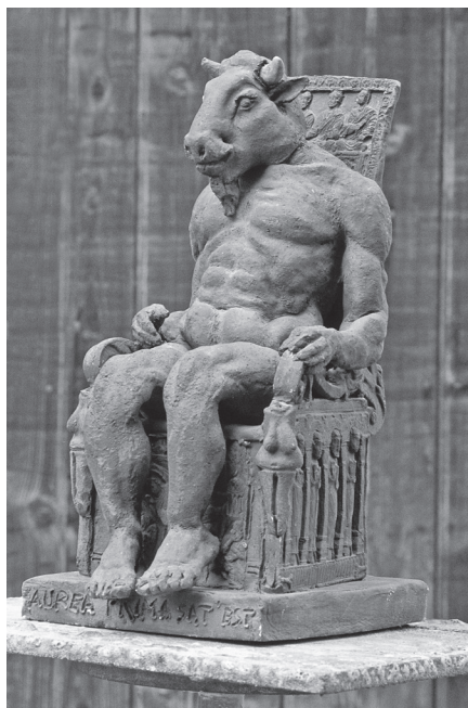
Aurea prima sat est (1985, raku)

ernyők ereszkednek lassan, akár szárnyas légió majdan, ha angyal-harsonájuk harsan.