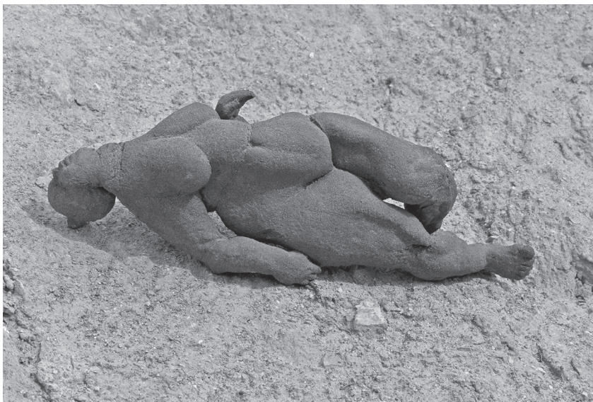
Hiú remény (1988, terrakotta)

sejti, míglen rajta üt az ordas agyhalál, jövőjében az énje várja: suta kéz? egekbe szárnyalás? nos, ez a tét – így éli át a jelenét, ki onnan visszanéz