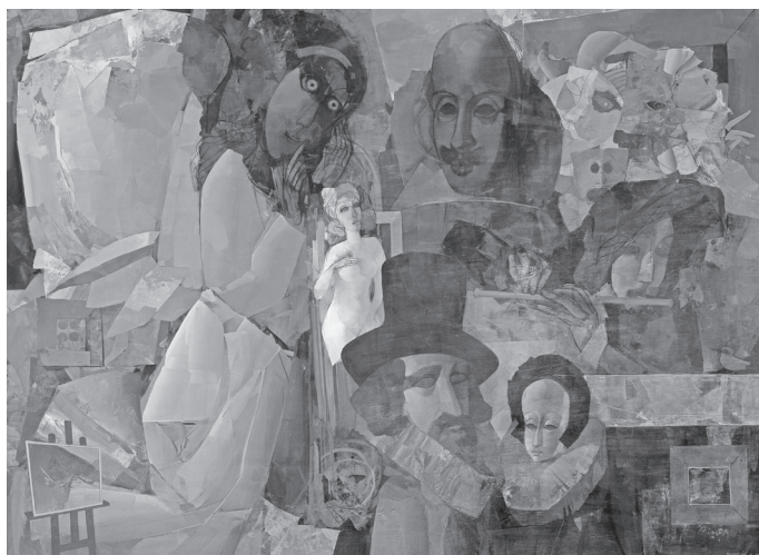
Virtuális műterem (2010)

ahányszor csak az ember a tüzét gyújtja. Ám van, ki hajóján minket is újra meg újra, párban – megmenekít.