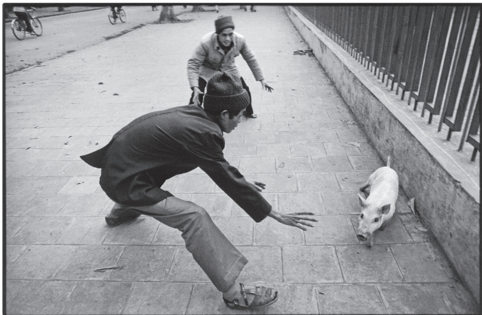
24 Hanoi. Vietnam, 1983

Behúzta táskáján a zipzárt, megfésülte festetlen, kopott színű haját. Még egyszer szétnézett kis konyhájában, majd becsukta maga mögött a bejárati ajtót, és elindult lefelé a lépcsőn. Apa már várta őt a ház előtt, az út másik oldalán.