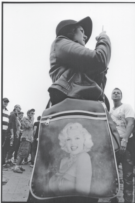
© Benkő Imre: Hajógyári-sziget. Budapest, 2016

Két bezárt égöv a szemed, és a színét sem látom soha, mert cigizel, és a sűrű konyha szűkén a tüdőd kitölti minden tered és időd. És különben ennyi. Ennyit láthatok belőled, Te szent és kopasz dolog. De néha, hallgatom, ahogyan magadban beszélsz, tanulom, hogyan káromolsz, remélsz. De van, nem veszek észre, ülsz, mint konyhabútorok része, melyekben se hit, se hanyatló inger. Könyvet olvasol, a címe „Hitler”. És mégis, bűdös részegen, mikor kiválsz a bútor éleken és meggyűlsz mellém, mint bénában a mozdulat, hogy szótlán kinyilatkoztasd, az édesapám vagy, megszeretlek. Mindenkinél jobban. És ölelnék, és ölelnél ebben a kettőzött titokban. De nem. Mert ilyen a szíved, hideg és meleg, mint az Istené, ritkán, de szeret.