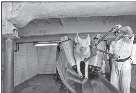
© Benkő Imre: Vágóhíd. Budapest, 1997

nőtt a veszélyeztetett Gizellák populációja