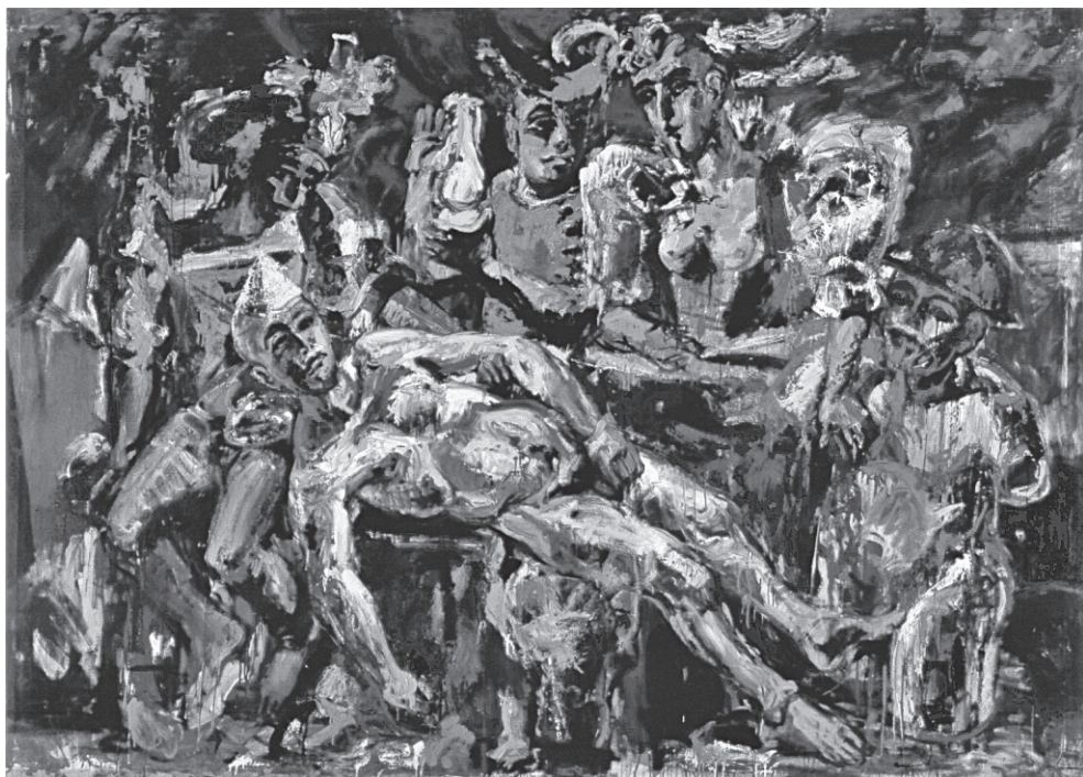
Arlecchino II. (1995, olaj, vászon, 210×290 cm)

Mély tenger a csönd, hulláma verdes az éj falán, magába szív, elönt, s a sötét visszhangja hallatán táncol a sűrű bokrokon, átjárja lassan lelkemet, már sejtjeim között oson, az álom szárnyain remeg, a vágycsók fövenyén hömpölyög, égő szemembe szivárog, és a hulló levelek között átszövi az őszi világot.