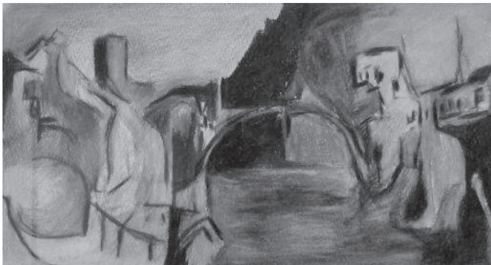
Nem jutottunk el Mostarba – Csontváry tiszteletére

tartanám a levegőt kezemben, mellemben a ravasz halál fogai már üzennek kígyóit növeszti testemben egy jéghegyben alámerülve mozdulatlanságom lélegzik a bennem lévő tükörbe nézek sínek futnak bennem csipke szálaira esnek szét mintha kvantum összefüggések lennének a karácsonyi birsalma és tehetetlenségem között melyet mint egy égetett cukor golyót görgetek magam előtt