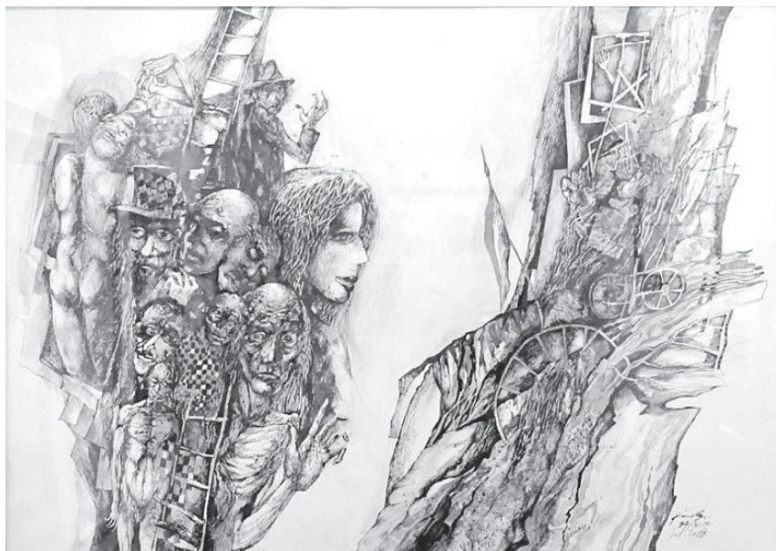
Intervallumok (vegyes technika, karton)