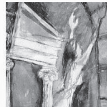
Kékszakállú herceg vára