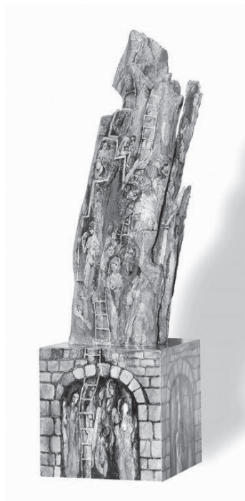
Kékszakkállúherceg vára (festett fa)

Havasi gyopár, te elsőszülött, hófehér, tisztaságodhoz földlakó fel nem ér. Sziklák közt vajúdva jöttél világra, januárnak reménység-virága. Nem tarthat fogva sziklaszirt, szabadon szárnyaló szirmaid megérintik a felkelő Napot, rajtuk semmi szenny, semmi por. Te tündökletesség, hegyek-völgyek éke, szépségre szomjas lelkek menedéke, úgy ragyogsz fenn magas sziklák tövén, mint Megfeszítetten a sugárzó fény.