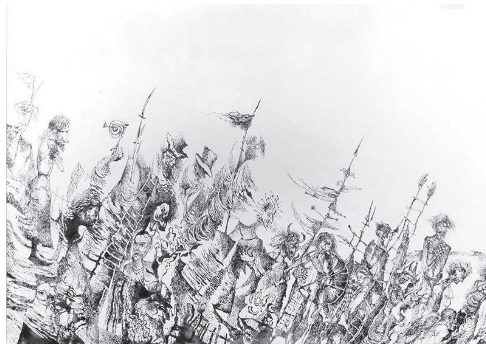
Invázió (tusrajz, karton)

Van egy térképem, melyen az ákombákomokat csak ő képes megfejteni. Remélem, nem árulja el senkinek, idővel valósággá öregszik.