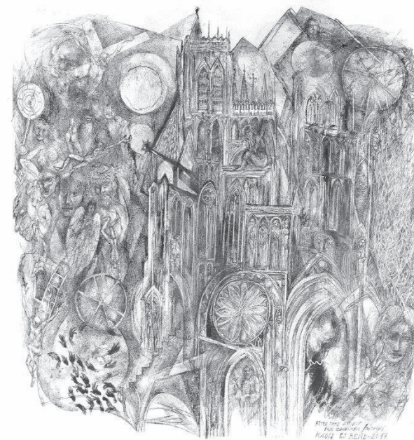
Rend és káosz (vegyes technika, merített papír)

meztelenre vetköztetve gondolataimat, még álmomban is szégyellem magam, pőre zokogásban törne ki belőlem a tegnapiok jaja, de nem tudok sírni, már egy fél éve nem... nincs már sem ajtaja, sem kilincse a vágynak lakat alatt, mozsárban tört csöndben haldoklik minden holnapom, szabadulásra várva; az írás szentsége is ketté török mint áldozati ostya nyelvet találni a végtelenhez, ez az, aminek értelme volna, de a dagadó lábak és légszomjak nászaiból csak csóktalan vágy fogan... ujjbegyeim vércseppesckéi mint vöröslő csillagok nem ragyogok már soha többet, szemem fénytelen, matt tükör; augusztusi csillaghulláskor török el bennem minden akarat, színtelen ilyenkor még a szivárvány is, egyetlen kincsem: a félelmem.