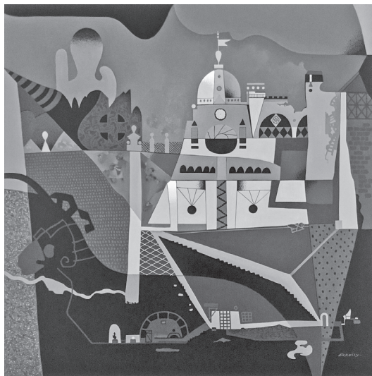
A kastély titka

Átsuhanóban egy őzbak megkoronázta e percet: – CARPE DIEM! Ragyogása üzent, és már eliramlott.