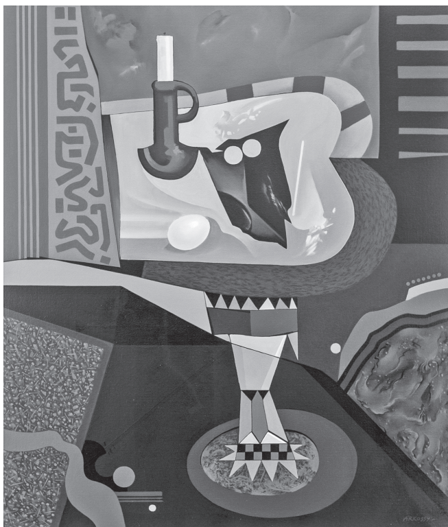
A fekete maszk

körben gond-zajok ébredő virágágy halkan mormolom hál' Isten van tovább.