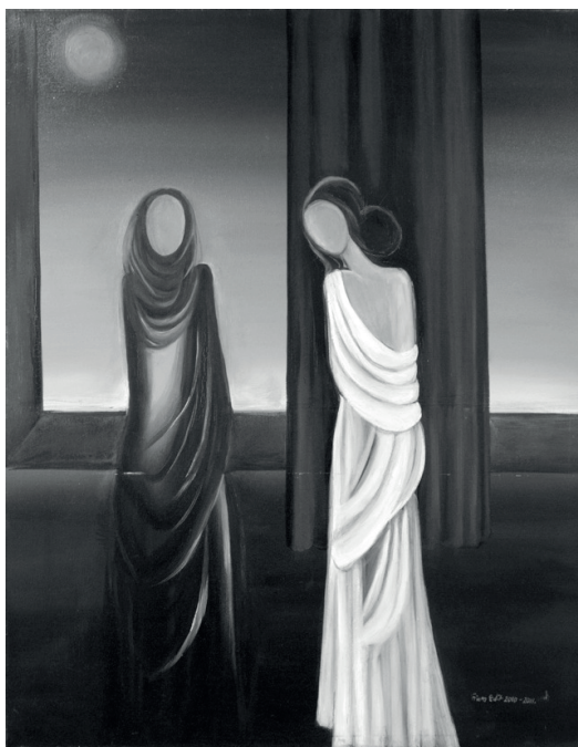
Finta Edit: Színpad II.