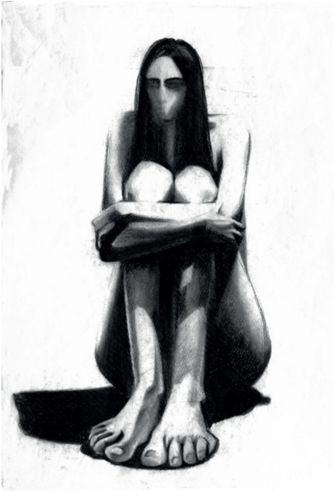
Finta Edit: Tanulmány a Várakozáshoz (szénrajz)

(Elhangzott a Magyar Újságírók Közösségének székházában 2015. március 12-én)