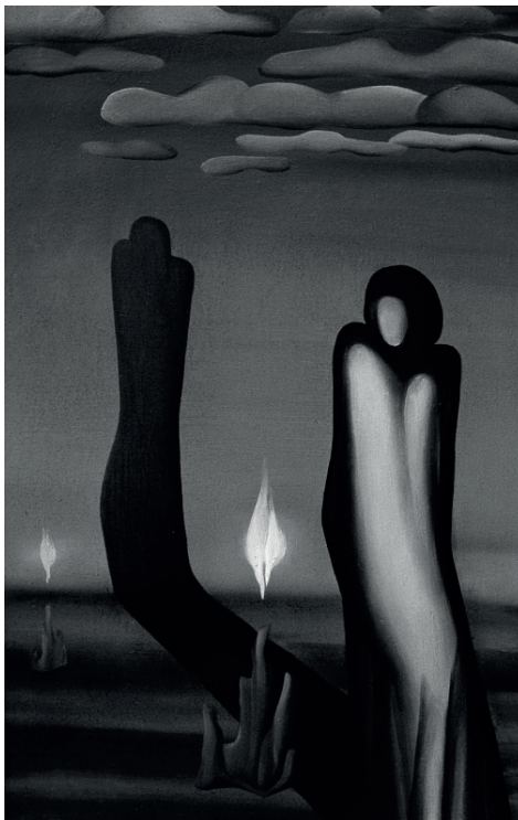
Finta Edit: Ballada (olaj, vászon)

29 Sztanó László: Taljánok, olaszok, digók. A nemzeti sztereotípiák fogságában . Corvina, Budapest, 2014, 493. o.