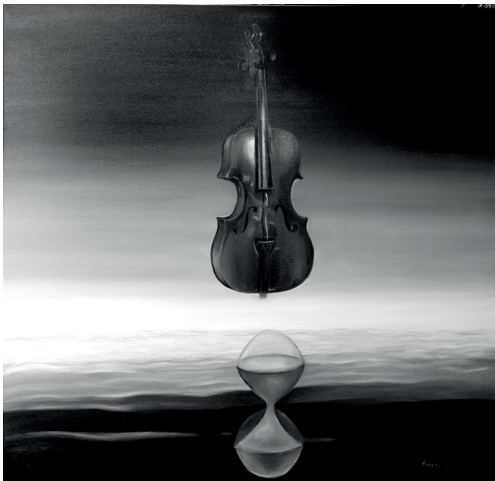
Finta Edit: Elfolyó homok csöndje (olaj, vászon)

mélységes éj, fény sem szennyezi, közel jönnek a fák, a bokrok, érezem, ahogyan megdobbann a lélek, vagyok, mindenbe és a mindenségbe oldott széjjelhajló két karommal visszaölel az ég, a föld, az éj, mélységes éj.