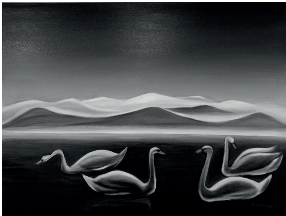
Finta Edit: Békés csend (olaj, vászon)