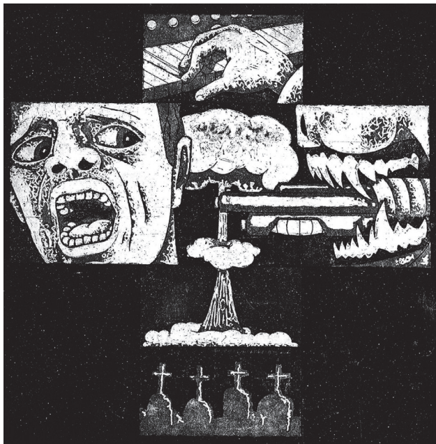
Az erőszak képlete

Isten süvítő lélegzete, fehéren porzó szemközti háztető, csapódó fekete árnyak, károgó zene, bent vánszorgó percek, bicegő idő. Így érkezett, s tűnt el a hatvanöt, egy ajtó mögül felsejlő emlék, elszürkült remény bordáim mögött, melyért még tonnákat felemelnék. Tétován felállt, menni kellett, karjait nyakam köré fonta, keblével nyomott mellemre pecsétet, lobot vetett, s kimúlt arcomon a csókja. Torkomból kiszakadó szavak szétkiáltva hóviharba, szélbe, kincsemből ím, semmi sem maradt, felizzott, s ellobbant e világi létem legeslegutolsó ölelése.