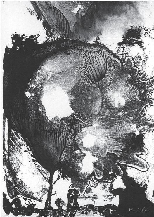
Hlavács Éva grafikája

akkor, gondolod, a jégeső találna magának puszta földet a virágok között?