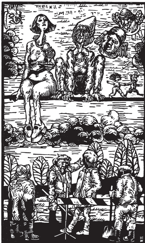
Herczeg István grafikája