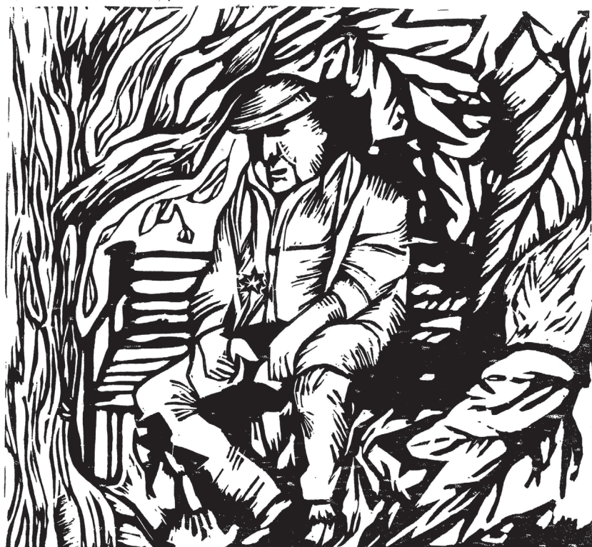
Tompa Mihály: Ősszel – illusztráció

A béres-kosárfonó, de inkább a kosárfonó-béres Öregapám, illetve a lovász-kocsis-gazdász Apám teljesen különböző típusú emberek voltak. Az Öregapám nagyon egyszerűen megfogalmazta, hogy miért lett Ő inkább béres, mint kocsis: „A lovak igen kényesek...” Persze van ebben valami, meg talán abban is, hogy az ökrök is, meg a lovak is szinte kiválasztják a nekik leginkább megfelelő embert. Hajjaj, de még mennyire!