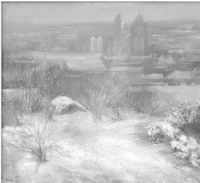
Eger a műteremből 2.