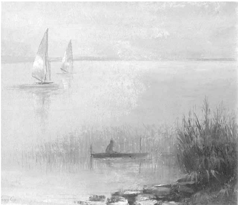
Vitorlások a tározón