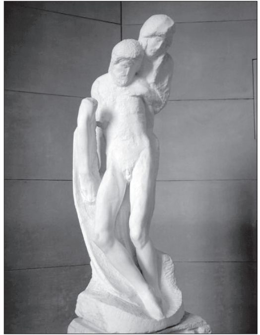
Rondanini Pietà (1564)

eredetiség fogalmához, mindig a művészi látásmódhoz, az alkotó egyéniségéhez jutunk. Ez arra ösztönöz, hogy ha egy művet látunk, ne csak annak primer hatására figyeljünk, hanem felkutassuk annak hátterét, tehát hogy átéljük annak misztériumát is. Így eljuthatunk a korhoz, amelyben keletkezett, a kor ideológiai, történeti, esztétikai jellemzőihez, de eljuthatunk a mű alkotójához, s legbensőbb énjéhez – gondolataihoz, érzelmeihez – is. Ezáltal a materiális önazonosság mellett egy szuverén szellemi, idealisztikus aura is körül veszi az újkor kezdetétől a műveket. De ez az idealisztikus aura már nem volt azonos a kultuskép vallási ihletet kiváltó, egyébként örök igazságokat magába sűrítő hatásával. Mindez – így a 19. század végétől a 20. századon átívelő