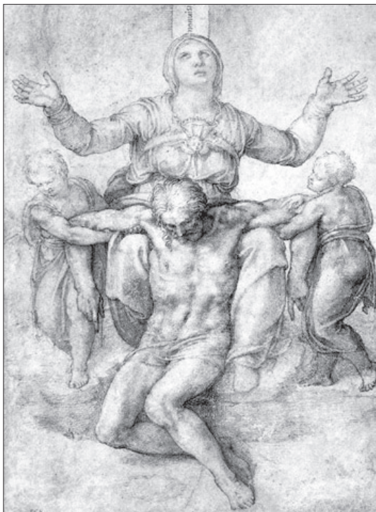
A Vittoria Colonnának ajándékozott Pietà (1546)

Azt a Pietà-rajzot, amelyet Michelangelo Vittoria Colonnának