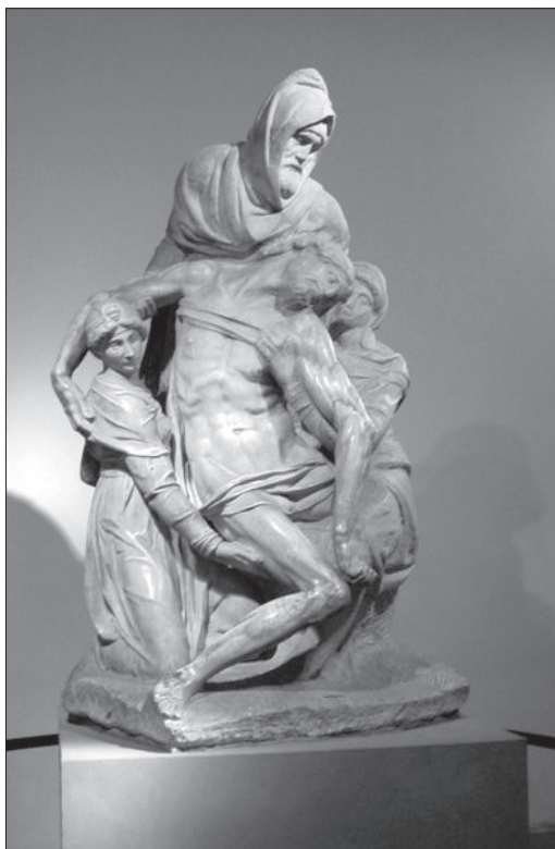
Firenzei Pietà (1557)

A reneszánsz művészet azért jelent nagy változást a művészettörténetben, mert ettől az időtől kezdve a mű általános szellemi jelentése mellett egyre inkább a mű egyéni szellemi tartalma, eredetisége kezd lényegessé válni. Akárhonnan közelítünk az