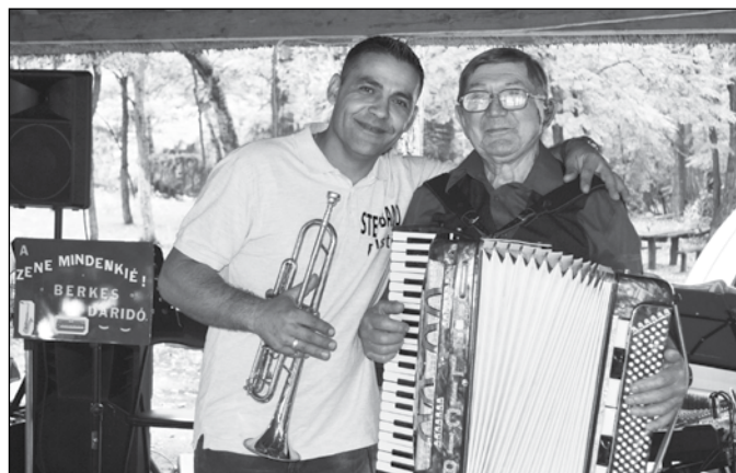
A zenésztalálkozó szervezőjeként a parkerdőben (2019)

részt. 1967-ben kezdtem az akkori Tanácsnál dolgozni. Akkor 2.700 lakosa volt Bócsának. Azóta mintegy ezerrel van kevesebb. 1971-től a szövetke-