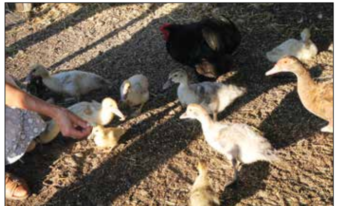
Kiskacsák egy cochin kakassal

vásárban vettünk kislibákat, azok felcseperedtek, most már nagyok. Mindegyiknek van neve: Kislétra, Géza és Gizi. Ez itt pedig egy magyar kacsá. Barna színű, zöld fejtollazat-