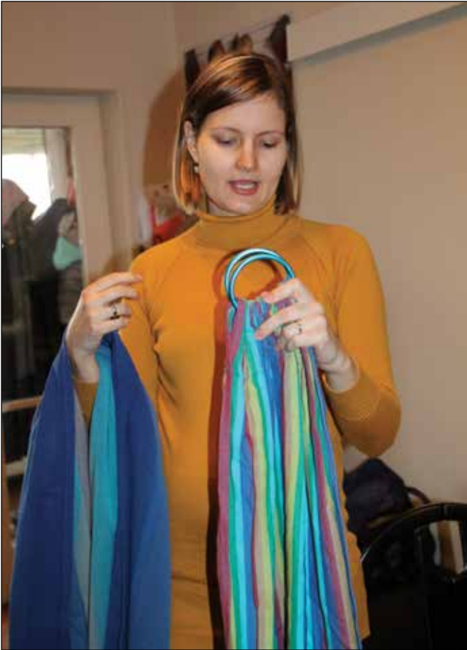
Folytatás a 10 oldalról. Ez pedig itt egy „karikás”

hető! Egy kendő akár több gyereket is kiszolgál.