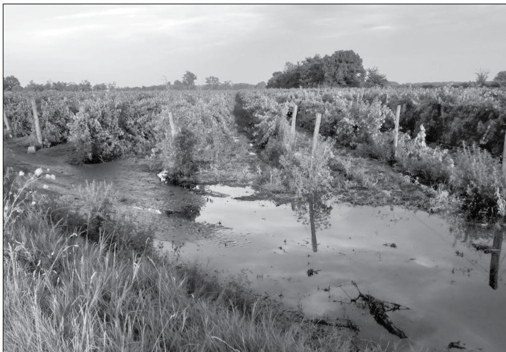
Útmenti szőlő a vihar után 2020 augusztusában

A szerkezetátalakítási támogatás keretében folyik ilyen