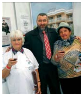
Két nyertes az Expon

Sok jelzõt lehet felsorolni a „jó turistára”. Beállítottságtól és érintettségétől függően több mindent mondhatunk: kedves, többször eljövõ, sokat költõ, nem követelõzõ, itt alvó... Az egyik célcsoport a jelen Magyarországon kétségkívül — ki hinné? — a nyugdíjas korosztály! Ők azok, akik csoportosan utaznak, és noha aránylag kispénzûek, de szeretik a törődést és a kedvességet. Jó