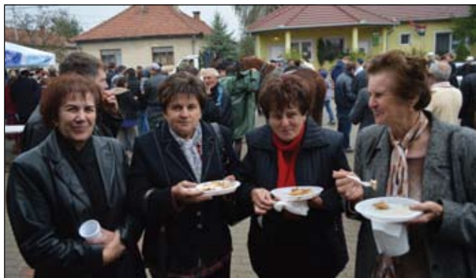
Az Önkormányzati Hivatal zöldséges csirkét kínált a fevonulóknak