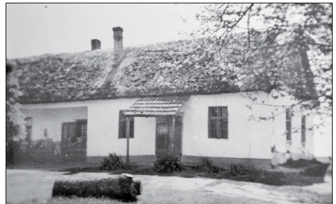
A volt Kosztra iskola

Hozzánk bármikor lehetett jönni! Ezt példázza a következő eset: egyszer a harmincas években Bugac szélén katonák táboroztak. A postájuk Bócsára járt. Az egyik kiskatona szállítólevelet kapott, s kérdezte, hogy mikor jöhet a csomagjáért. 'Holnap bármikor kiadom' – válaszolta a mama. Éjjel 2-kor verik ám az ablakot! Kiszült, hogy lovakat legeltettek a katonák, s a kiskatona meglógott a postára. A mama nemcsak hogy beengedte,