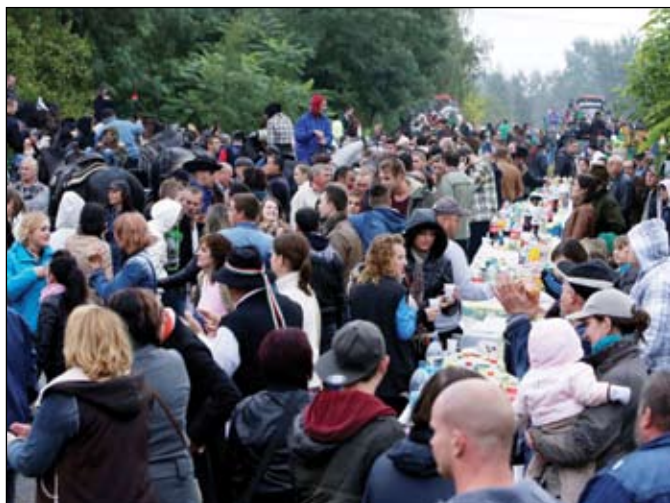
Katzenbach Faluban is nagy volt a tolongás