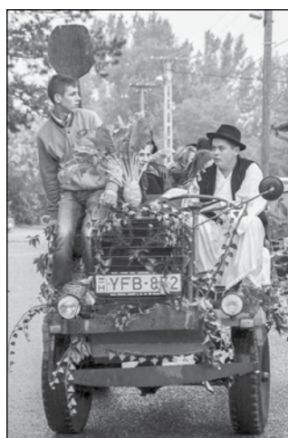
A felvonuló csettegő dísze