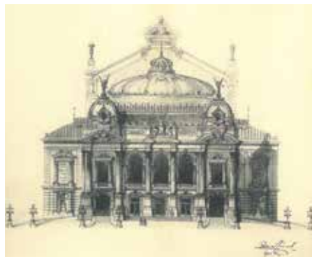
Bobula János terve a Vígszínház főhomlokzatáról, 1891