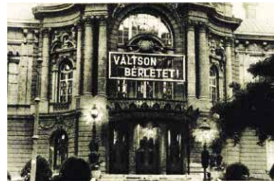
Neonreklám a Vígszínház bejárata fölött, 1930

és közel 40 éven át tartott. Jelentőségüket az adja, hogy a köznép számára egy olyan átgondolt, kiforrott színházépület alaptípusát alkották, amelyet a későbbiekben Európa-szerte alkalmaztak. Az épületek külső formálásában az aktuális építészeti stílusokat követték, azonban a belső kialakításban és a színpadtechnika terén már törekedtek a korszerű megoldásokra, mint például a süllyesztett zenekar és a hidraulikus színpadtechnika alkalmazása, vagy a villanyvilágítás és a vasfüggöny használata.