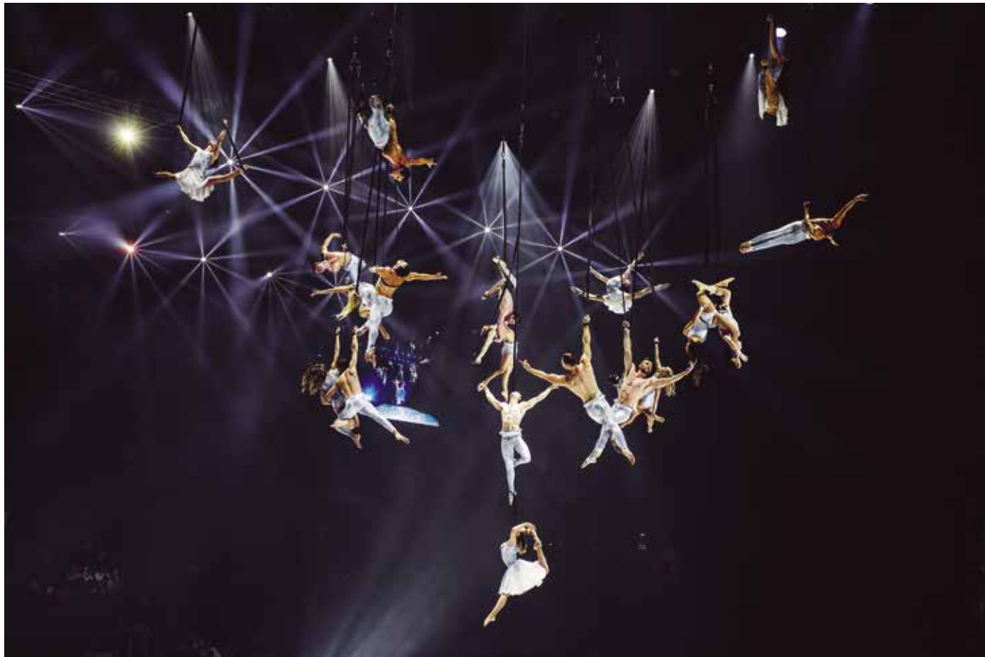
A 2017-es budapesti FINA záróünnepségén előadott műsor néhány pillanata

A világhódító magyar újcirkusz társulat története