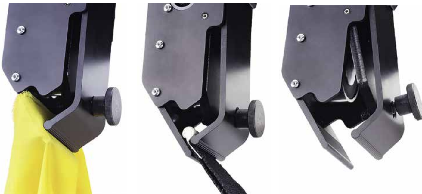
Az ejtőegységek mágneses csíptetői minden textilanyaghoz használhatók

A KABUKLIP függőnyejtő rendszerről, amely a legnagyobb varázslatokat hivattott életre kelteni