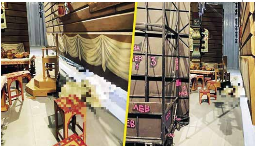
A balesetet rögzítő videoképek, kikockázva a pontos helyet

A tragédia helyszínén azonnal megkezdték a nyomozást, hogy kiderítsék a baleset pontos kö-