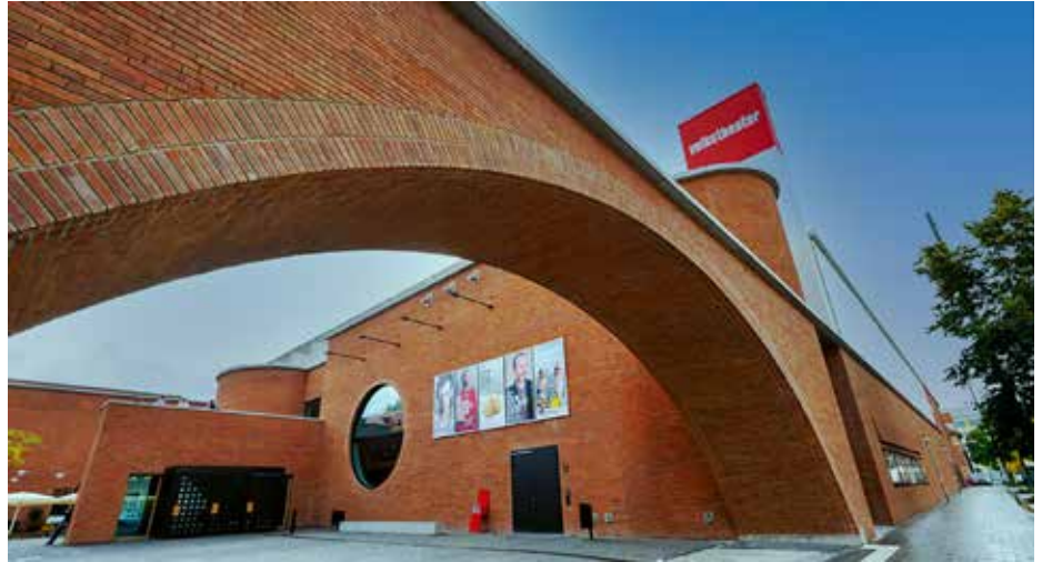
A müncheni Volkstheater bejárata és nézőtere