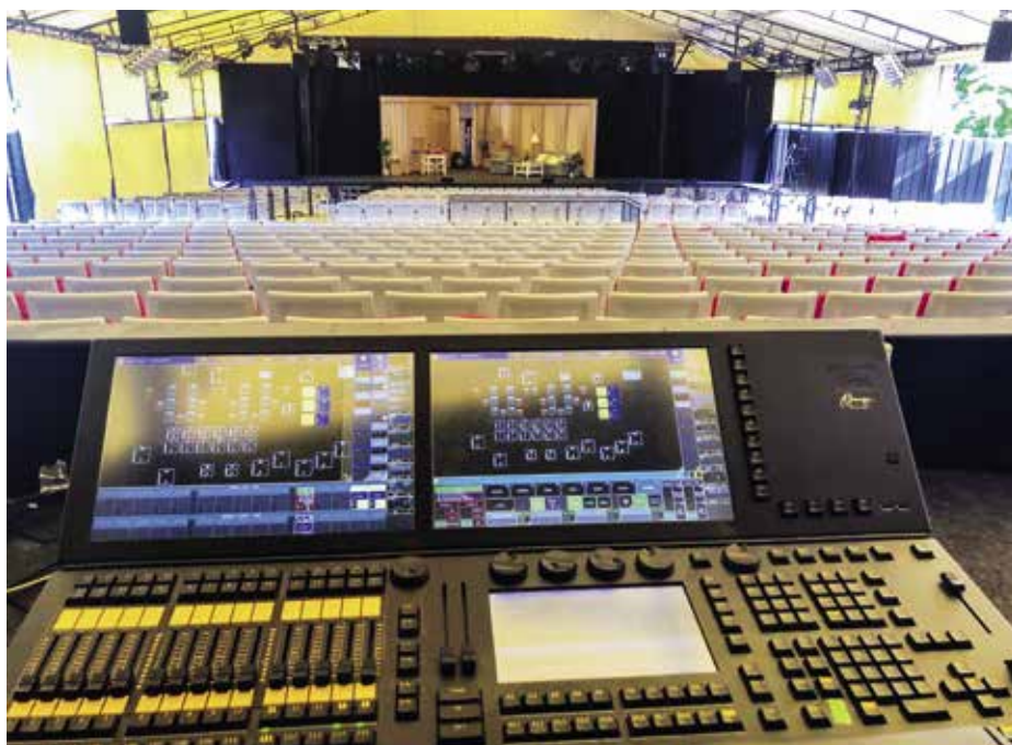
A nézőtér a színpad felől

történt, viszont érdemes kiemelni, hogy 2010-ben egy számottevő műszaki átalakítás alkalmával sátozottóval lefedtük a nézőteret. Azonban sem a színpad, sem a nézőtéri székek felújítására, cseréjére nem került sor, ami a székek állapotán mostanra meg is látszott.