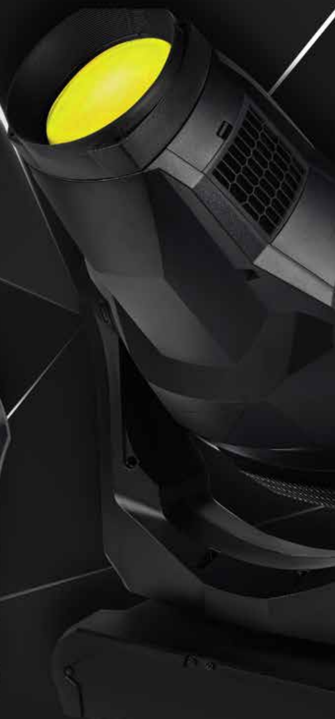
MAC Ultra Performance