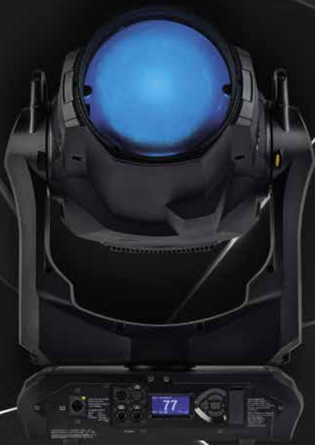
MAC Ultra Wash