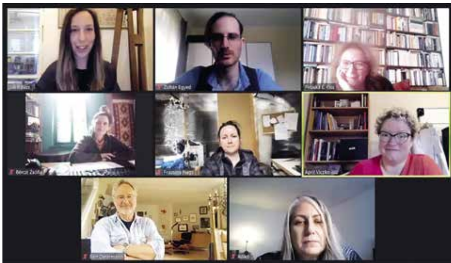
Nemzetközi találkozás a Zoomon

A harmadik díj a Theatre Architecture Competition (TAC), ami kimondottan az építészeknek szól. Ez a pályázat egy különleges színházi építészeti tér megtervezését tűzi ki célul a jelentkezők számára. Rendkívül érdekes és elgondolkodtató művek születnek, még akkor is, ha ezek megma-