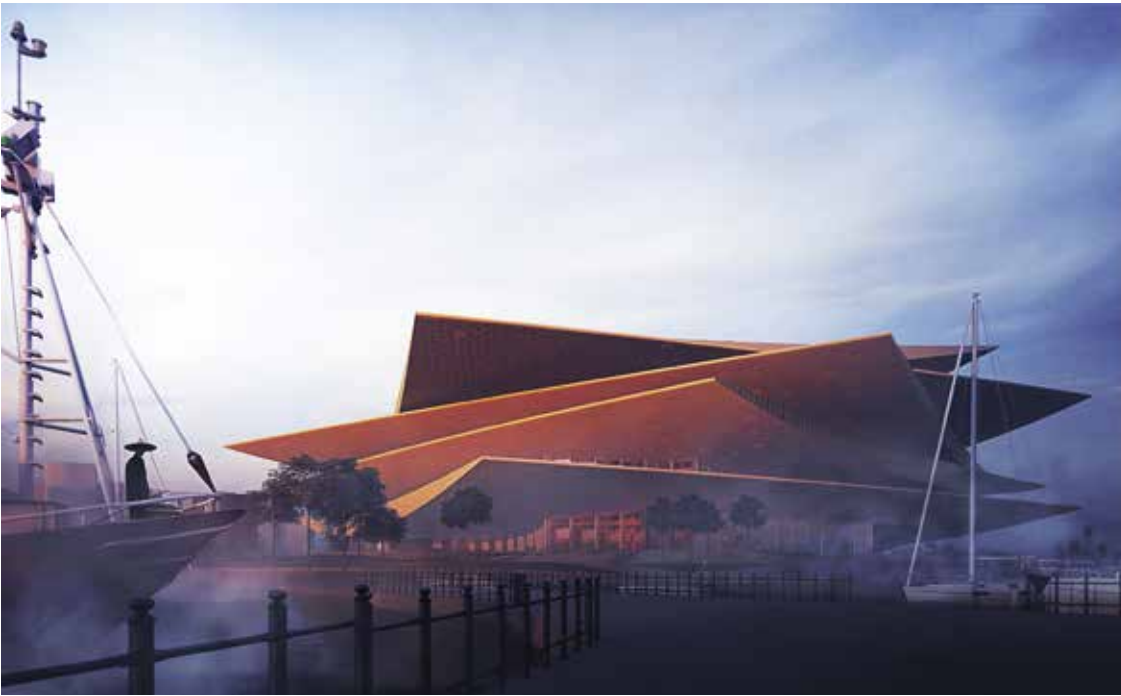
A Robert Gutowski Architects pályaműve

kihívás számunkra a tradicionális opera szerkesztésének megújítása volt. Tudatosan belementünk egy újítási kísérletbe, hogyan lehet feloldani a nézőszám-növelési igény, a színpadtól való távolság és a térben elhelyezkedő egyes székcsoportok akusztikai élményének egyenetlensége között húzóód feszültséget; vagyis megoldható-e, hogy magasabb nézőszám ellenére is közelebb ülhessünk a színpadhoz, mindezt oly módon, hogy soha nem „látott” akusztikai egyenetlenséget és teljességérzetet biztosítsunk. (...) A patkó formában elhelyezkedő galériák széksorainak számát büntetlenül nem tudjuk növelni.”