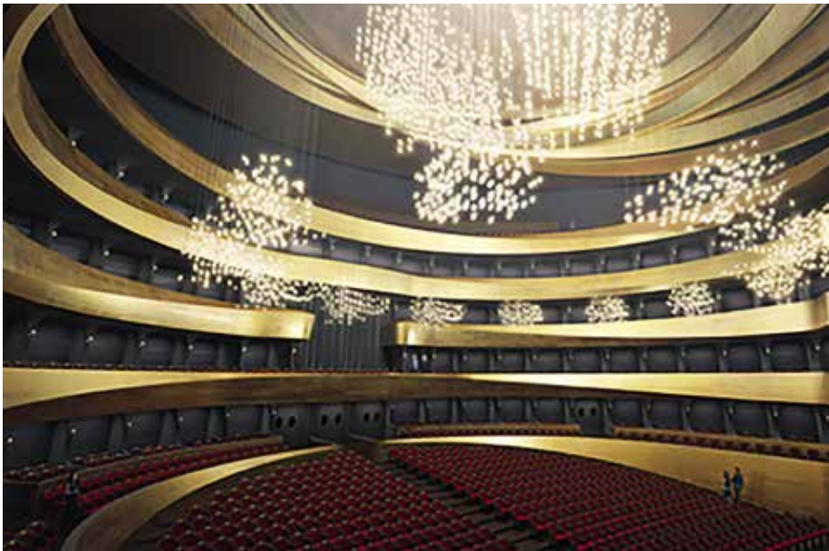
A ZDA - Zoboki Építésziroda tervének nézőtere

▶ közzé az összesen négy fordulóból álló nemzetközi verseny végeredményét.