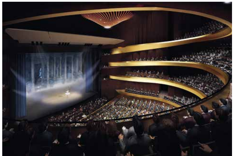
A Robert Gutowski Architects tervének nézőtere

Az erkélyek számának növelésével a nézők túl magasra és nagyon messze kerülnek a színpadtól. „Nem véletlenül alakult ki a tradicionális szerkesztésben, hogy a galériák relatíve kevés székkal bírnak, és a hiányzó létszámot a legfelsőn régen állóhelyekkel pótolták. Ezek egyébként nem rossz helyek, de kétségtelen, hogy aránytalanul