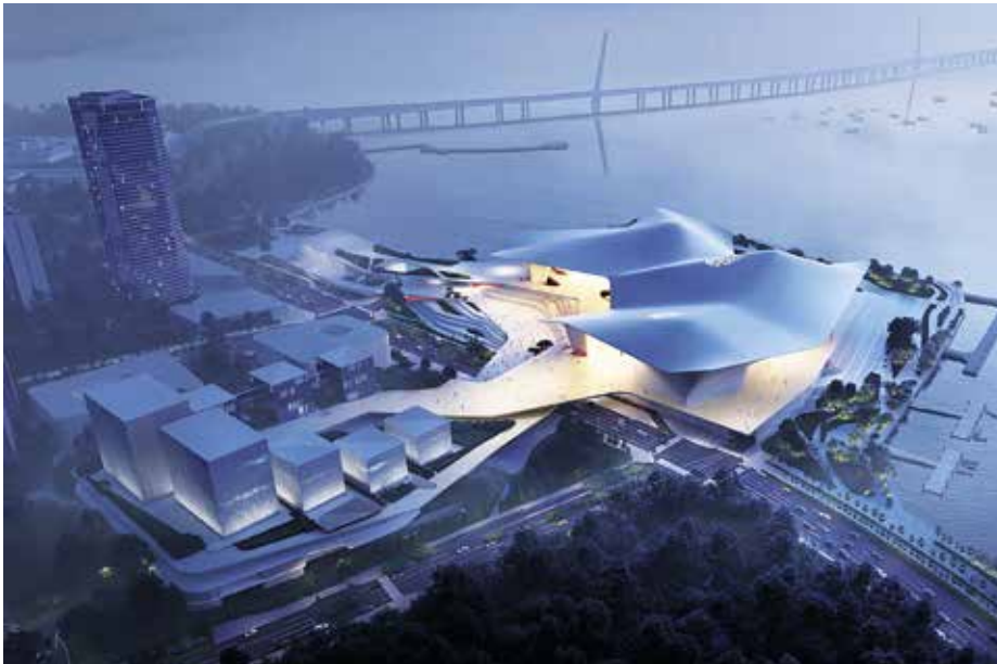
A ZDA - Zoboki Építésziroda pályaműve