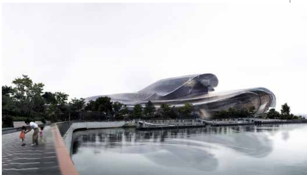
Jean Nouvel díjnyertes Operaháza a tenger felől

A nemzetközi tervpályázat volumenét és színvonalát jól érzékelteti, hogy többek közt olyan iko-