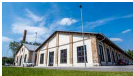
A Márk Tivadar jelmeztár épülete, háttérben a Tolnay Pál üzemeltetési központ

Maga a költözés gyakorlati és logisztikai téren sok feladatot adott, hiszen a három varroda és a parókaműhely átköltözésének ütemezésekor arra