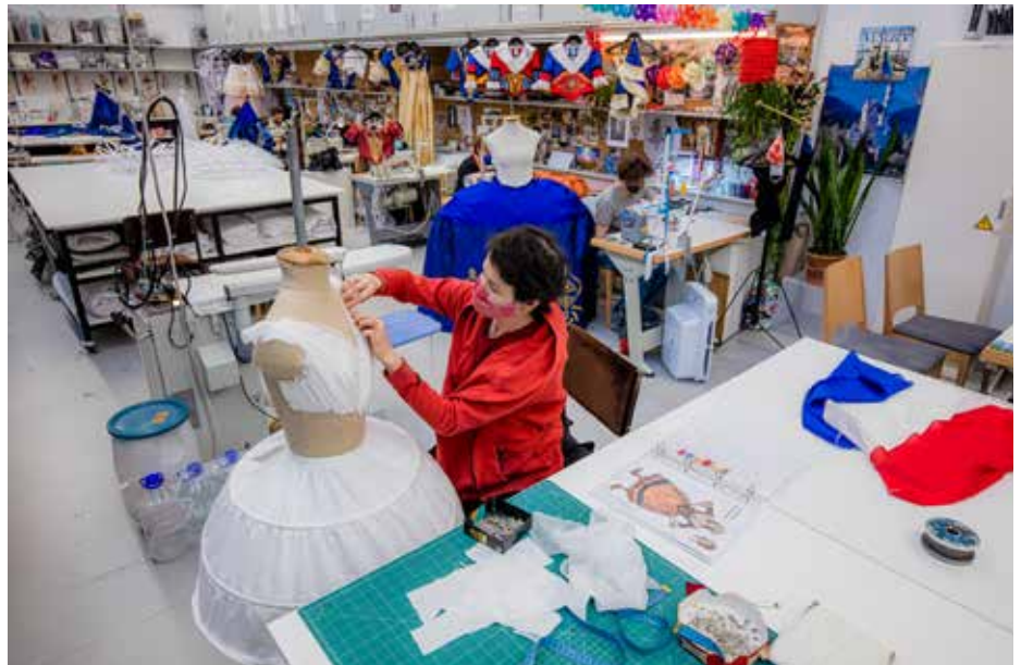
Képek a jelmezműhelyből