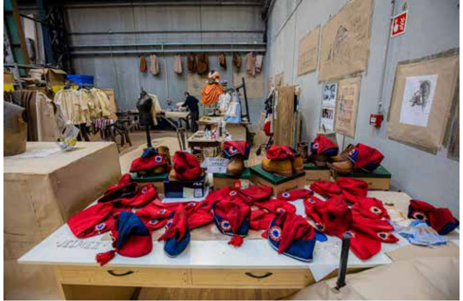
A jelmezfestő műhely