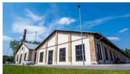
A Márk Tivadar jelmeztár épülete, háttérben a Tolnay Pál üzemeltetési központ

Maga a költözés gyakorlati és logisztikai téren sok feladatot adott, hiszen a három varroda és a parókaműhely átköltözésének ütemezésekor arra