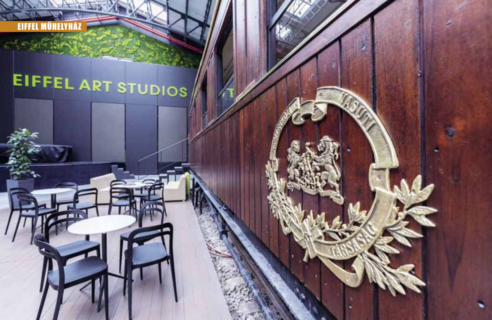
A Wagon-Lits tükfa burkolatú étkezőkocsijának címere