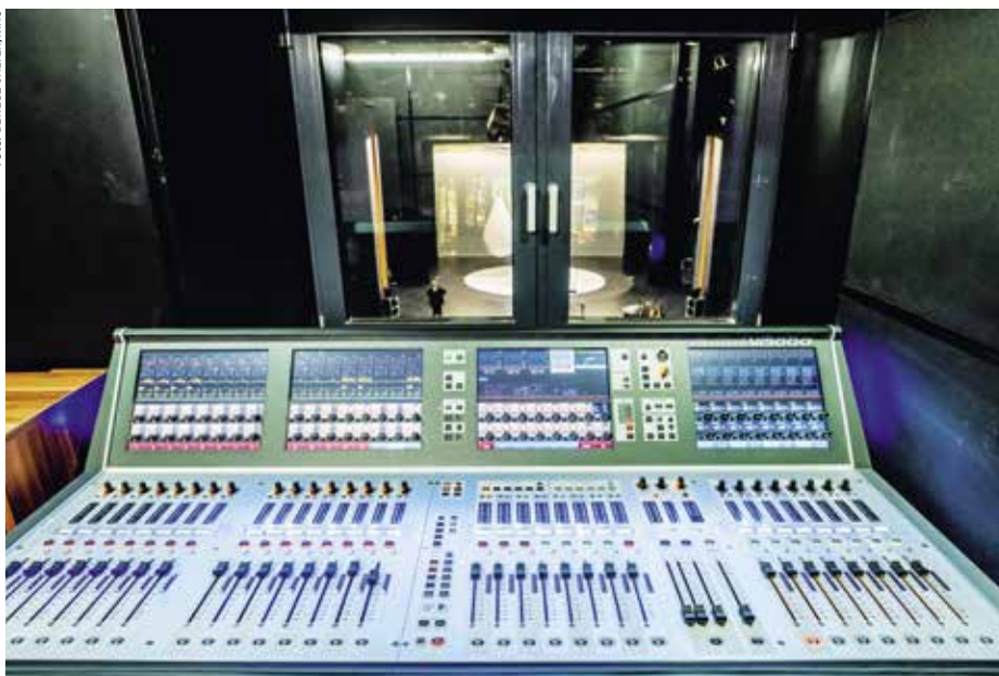
A Bánffy Miklós terem hangkeverő pultja

térként funkcionál majd. A varrodákra kétoldalt lenéző 13-13 ablakfülke szárítottmoha-díszítést kap, az oldalfalakon pedig itt is folytatódik a Mozdonycarnok sárga és zöld árnyalatait hordozó színvilág. A két kis beugróban, szintén rekreációs céllal, egy-egy konditerem kialakítását tervezzük. Az Oázisnak a Járay sportpálya felőli oldalán szintén átlátszó polikarbonát fal biztosítja majd a hangszigetelést, míg a Járayra letekintést biztosí-