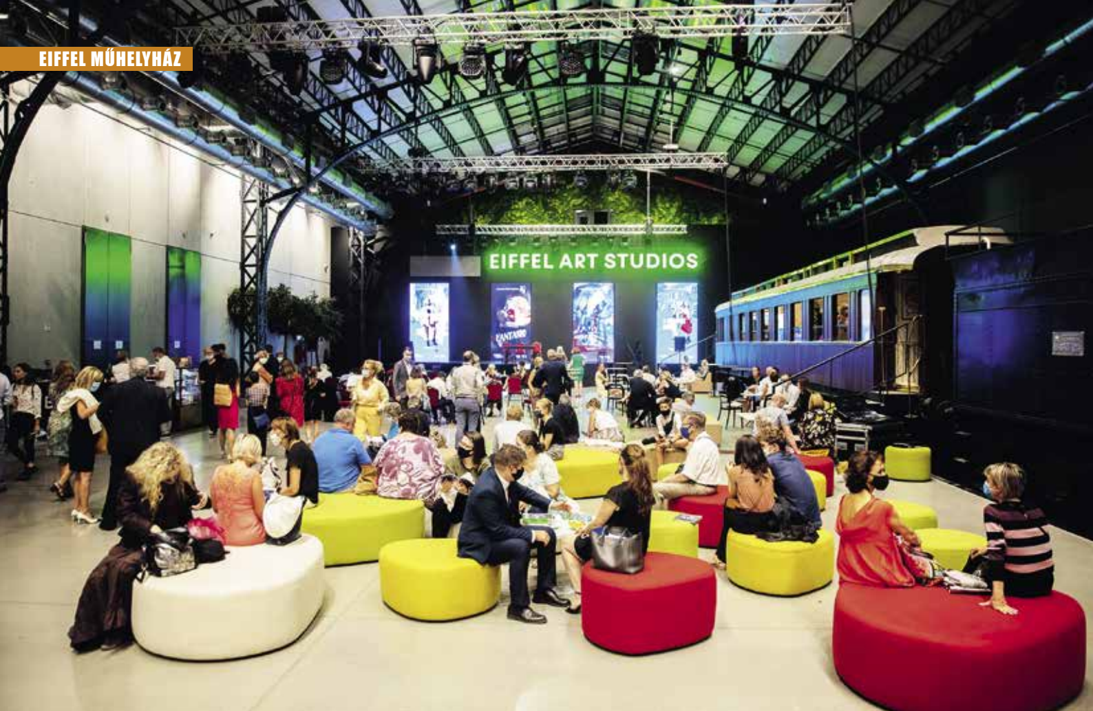
A Mozdonyesarnok hangulata

▶ Bánffy Miklós terem mozi-, hangosító- és kamerarendszerrel is gazdagabb lett. A 40 független hangesetornás Dolby Atmos hangrendszer beépítését tavasz végén a hangszórók, erősítők finomhangolása követte. A 4K-s vetítésélményt egy nagy erejű, sokoldalú Christie 4230-as, 6 kW-os izzóval ellátott, xenonlámpás projektor szolgálja, ami a tervek szerint opera- és művészfilmek vetítése mellett befogadott rendezvények, mozipremierek megtartására is alkalmassá teszi a Bánffy termet. Ugyanis a bevásárlóközpontokban található multiplex mozik többsége kevésbé alkalmas a vetítéseket követő fogadások megtartására, szemben a Mozdonyesarnokkal, amely erre kiváló lehetőséget kínál. Az installálás szükségessé tette a vezérlők ablakainak átalakítását, mivel a projektor a mozivetítés mellett lehetővé teszi a színpadi előadásokban egyre inkább alkalmazott vetítéstechnika kiszolgálását is. A teremben szintén április végén fejeződött be a hangrendszer installációja a zenekari árok fix mikrofonjaival, amelynek eszközbeszerzése még a múlt év végén zárult le. Ez a rendszer váltja ki a korábban belógatott, illetve állványra kihelyezett mikrofonokat az online előadások közvetítése, illetve rögzítése alkalmával, de szükség esetén élő előadások hangosításához is alkalmazhatók. A 6-8 fix telepítésű kamerapark, amelyekkel az online közvetítések megvalósítását tervezzük, egyelőre beszerzés alatt áll; ezenkívül van egy alap ügyelői kamerarendszer, ami 3 to-