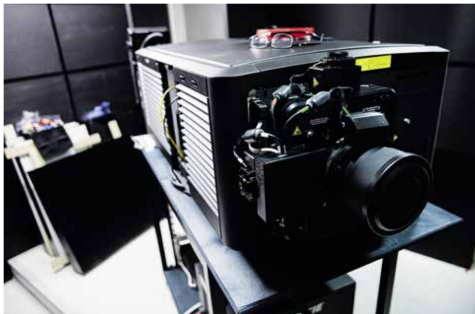
A Christie 6 kW-os projektorának beszerelése

a saját szcenikai műhelyünk gyártott le és a díszítő kollégák helyeztek fel. A Fricsay stúdióban az utóhangolás részeként a mennyezeti hangvető paneleket is beállították a kollégák, és egy AVID S6 pult formájában megérkezett a végleges hangvezérlő berendezés, amelyhez az Opera egy komoly mikrofonparkot is vásárolt, így most az Eiffel Műhelyházban található Magyarország legnagyobb és egyik legjobban felszerelt stúdiója. A fejlesztéseket az is indokolta, hogy az elmúlt évad során