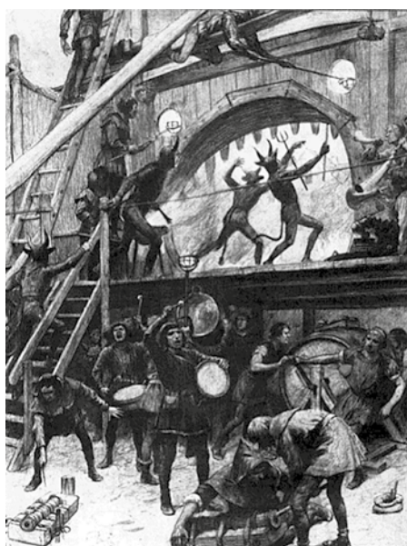
Viktória korabeli illusztráció: egy 15. századi misztériumjáték hangeffektusai

tész híres építészeti kézikönyvét. Ennek hatására új stílusú színházakat építettek – ekkor alakult ki a ma is használatos színházépület-típus –, és természetesen a színházi hangeffektusokban is úttörők voltak. A könyv végigvezet a shakespeare-i színpad effektusain (ezek közül sokat hangszerekkel értek el), valamint más effektek, többek között szélgépek, robajok, lovak, kocsik és eső hangjának megjelenését is leírja. A 18. és 19. század nagyszabású színházi előadásai igyekeztek valóság-hű viharokat, tüzeket és csatákat létrehozni, és sok korabeli mechanikus hangeffektusgép leírása és rajza megtalálható a kötetben.