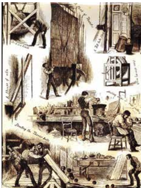
Színpad „meteorológia”: a természet hangjainak utánzása