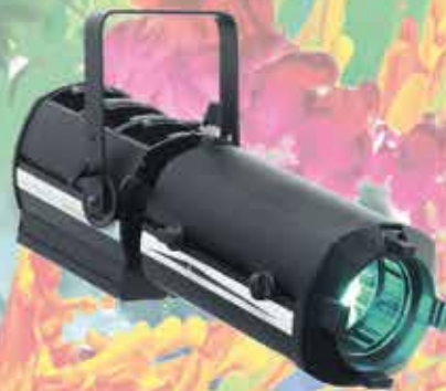
Hyperion PR 300 6C