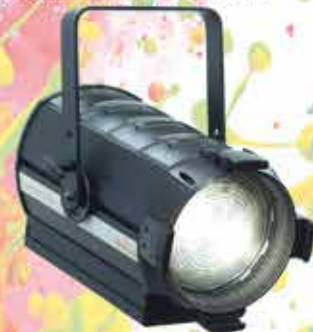
Hyperion FN 300 TW