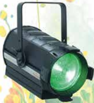
Hyperion FN 300 6C