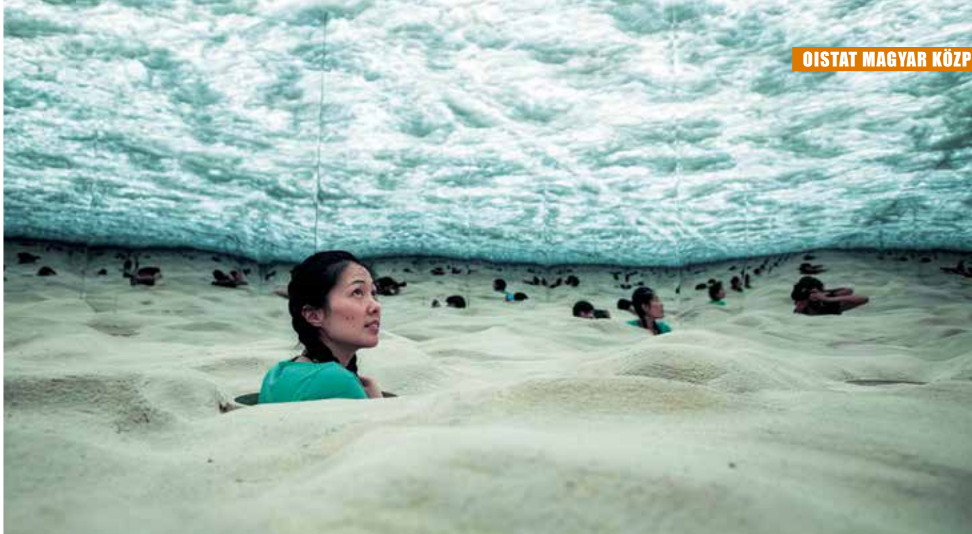
Végtelen dűnék. A díjnyertes magyar kiállítás belülről... PQ 2019

és építünk – továbbra is támogat bennünket. Ezúton is köszönjük munkáját!