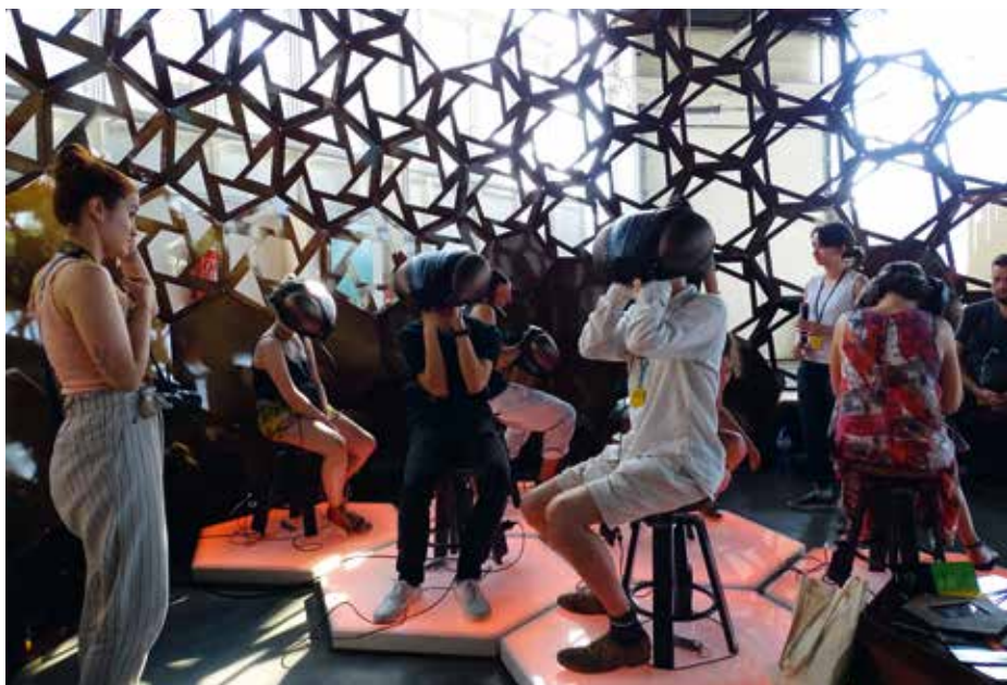
A virtuális valóság élménye egy kiállításon

Záró gondolatként azt kívánom, hogy tanuljunk a vándoralbatrosztól. Az albatroszok hatalmas, 2-3 méteres szárnyfesztávolságuknak köszönhetően igazi szárnyalásra teremtett élőlények. Évekig képesek szelni az eget anélkül, hogy a földre