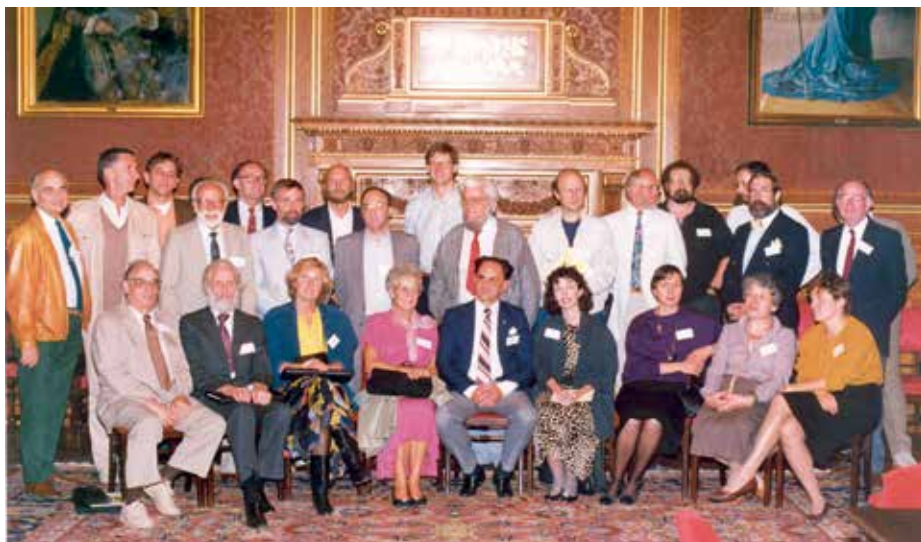
Az OISTAT publikáció- és információcsere bizottságának nagy sikerű ülése Budapesten 1990-ben

szállnának. Az első hat évüket teljes egészében a levegőben töltik. A tudósok sokáig nem értették, hogyan és mikor alszanak ezek az állatok. Végül kutatások során sikerült bizonyítani, hogy képesek repülés közben az egyik vagy akár mindkét agyféltekéjüket kikapcsolni. Ez lehetővé teszi számukra, hogy az alvás perceiben is az égen szárnyaljanak.