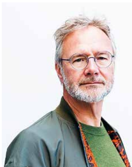
Bert Deterrmann, az OISTAT jelenlegi elnöke

hogyan tanul másoktól, vagy megoszod a tudásodat, tapasztalatodat, valamint részt vegyél egy szakmákat és kultúrákat magában foglaló nemzetközi diskurzusban, akkor érdemes fontolóra venni ezt a lehetőséget. Nagyszerű esély ez a hazai és nemzetközi szakmai kapcsolatok mellett hosszú távú barátságok kialakítására is. Az OISTAT eseményeinek jellegéből fakadóan arra is lehetőség nyílik, hogy a különböző szakágak között kommunikáció induljon el. Hiszen valljuk be, előfordulhat, hogy bár azonos az anyanyelvünk, de a szakmai különbségek miatt ugyanazt a tárgykört a szelőrzsza egy másik irányból szemléljük. Ebből adódhatnak félreértések, konfliktusok. Az OISTAT elhivatott abban, hogy ezeket a gondolati szakadékokat áthidalja, és így olyanfajta tudásközösség jöjjön létre,