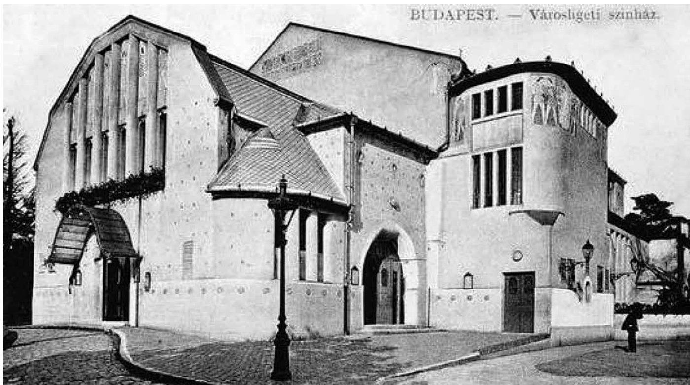
A Városligeti Színház épületét Vágó József és Vágó László tervezte. Az új épület egy év alatt készült el, a színháztechnikai felszereltsége is meglehetősen modern volt