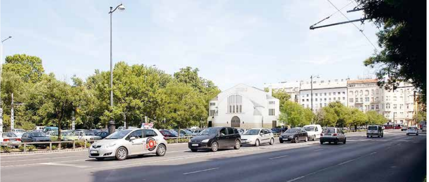
Az újrakepített színház látványa a Dózsa György út felől. Tőle balra épül az új, modern Néprajzi Múzeum

► elhelyezésére kínál megoldást, de a berendezések kiválasztása a kivitelezés határidejének kitűzésekor válik majd aktuálissá. Az előadást kiszolgáló helyiségek az elfogadott tervekben szerepelnek. A nézőtéren a mozgáskorlátozottak számára az egyesülettel egyeztetett módon külön is megközelíthető üléshelyeket biztosítanak.