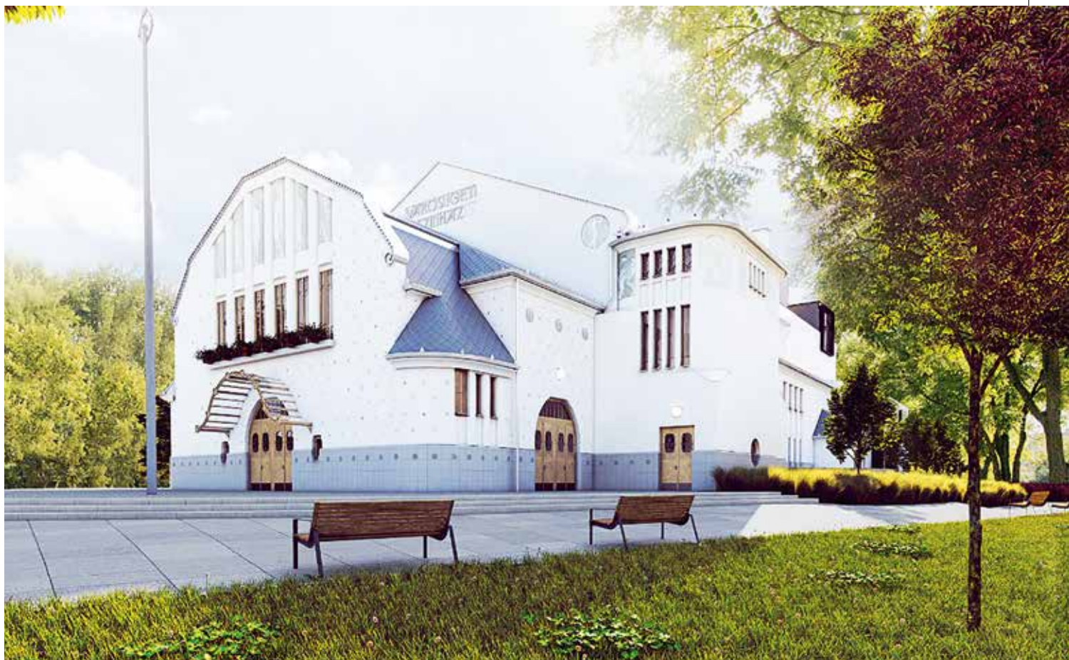
A szecessziós stílusban újraépített Városligeti Színház külseje a Narmar Építészeti Stúdió látványtervén. Belül a gyermekszínházi funkció szerinti alakítanak ki