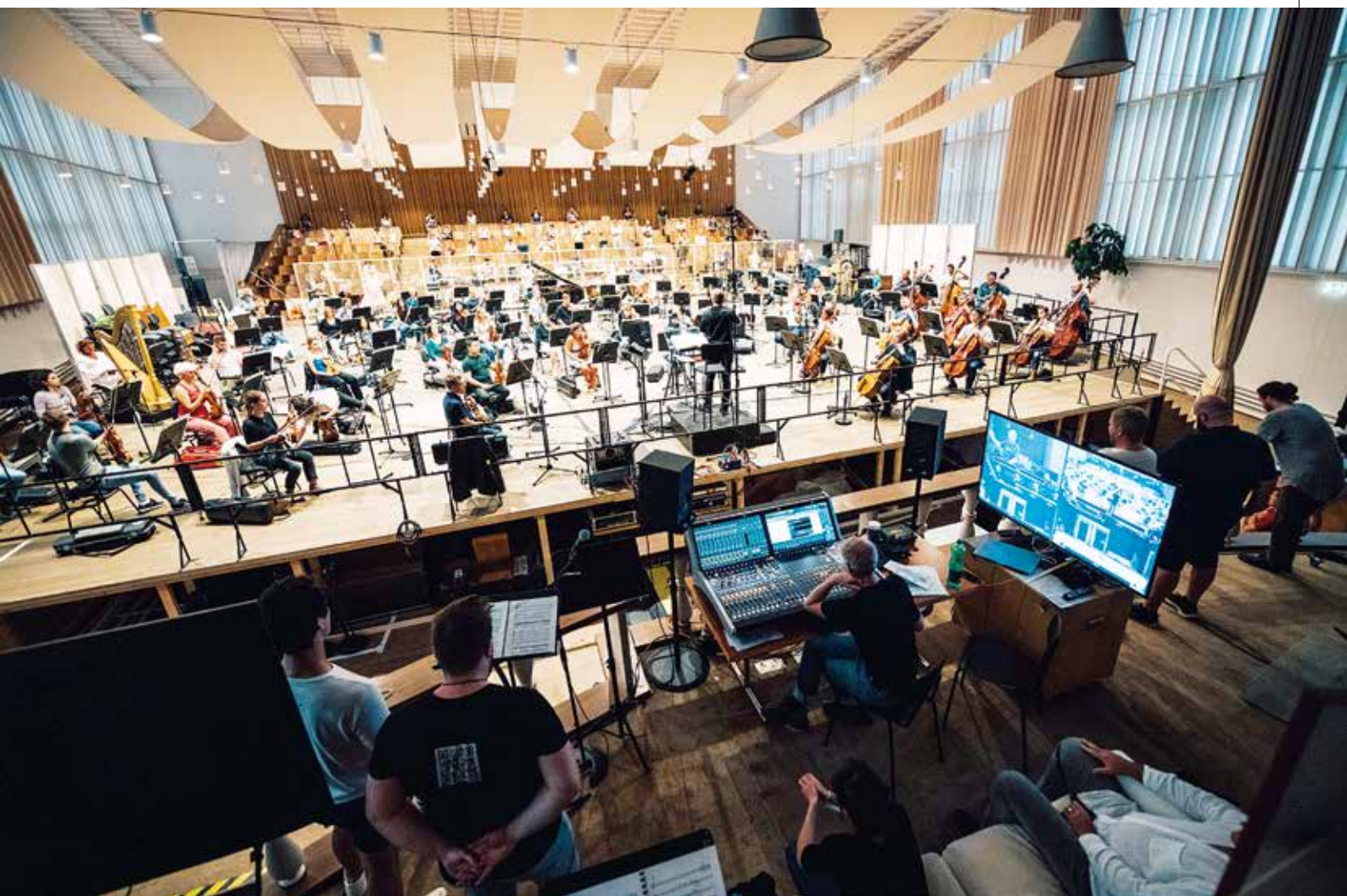
A zürichi Operaház átépített próbatermében rögzítik a zenekar és a kórus hangját, és élőben közvetítik azt a nézőterre, ahol egyidejűleg játsszák az operát

A nyári csonkított szabadtéri programok és az őszi évadkezdés optimizmusra adtak okot. A színházakban és operaházakban a „normál” működést – a maszkviselés mellett – ritkított műsorterv és rövidített előadások jelentették. A nagyobb nézőtereket és próbatereket használják, de légszűrő berendezéseket építenek be. Az elkövetkező időszakban a színházakat és a rendezvényeket a vírushelyzet súlyossága fogja jellemezni, ehhez kell alkalmazkodni. A járvány második hulláma ezeket a törekvéseket ellehetetlenítette.