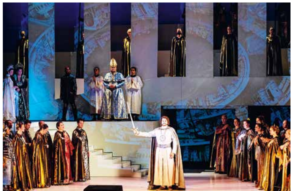
Szörényi L.–Bródy J.: István a király (hangszerelés: Gyöngyösi Levente, rend.: Szinetár Miklós). Erkel Színház, 2020. szeptember

Az Opera művészei, munkatársai, valamint a közönség egészségének védelme érdekében zárt térben – így a próbákban is – mindenki számára kötelező maszkhasználatot ír elő, az előadásokon közreműködő színpadi művészek és a zenekari fúvósok kivételével. Az épületekbe történő belépéskor érintésmentes testhőmérséklet-mérést végzünk. A védőtávolság betartása érdekében a közönség az előadásokat páros ülések igénybevételével