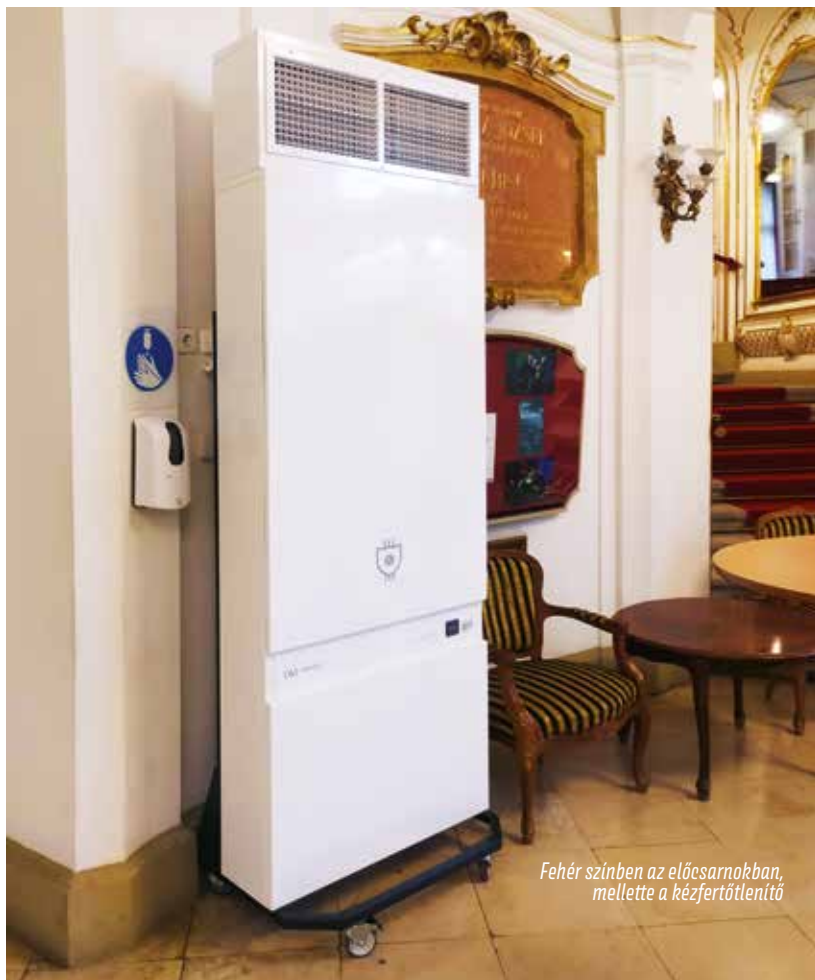
Fehér színben az előcsarnokban, mellette a kézfertőtlenítő