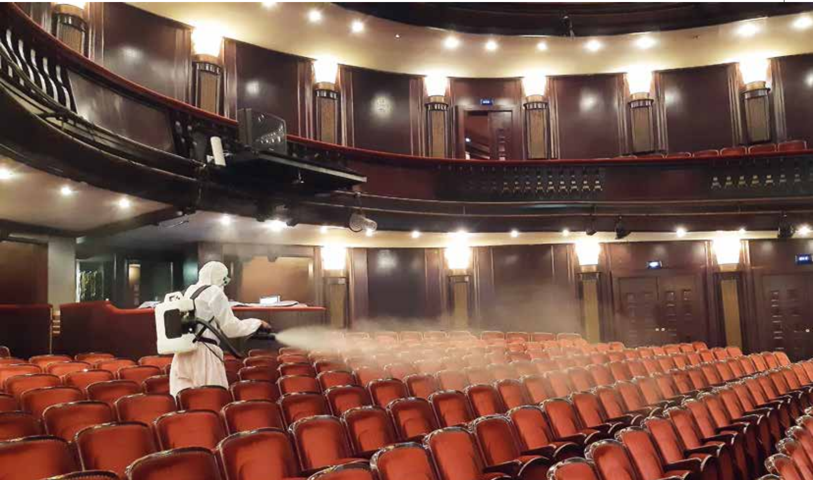
Fertőtlenítik a Madách Színház nézőterét

Szeptemberben még mindenki reménykedett, hogy a színházak megkezdhetik az őszi szezont, természetesen betartva a különböző szigorú egészségügyi előírásokat. Összeállításunk erről szól, a színházak számolnak be a pandémia idején folytatott gyakorlatokról. Sajnos a fertőzések exponenciális növekedése további szigorításokat, az élő színházi előadások megtartásának ellehetetlenülését és újból a teljes létbizonytalanságot hozta magával.