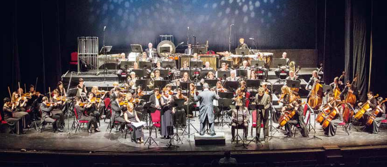
A Magyar Állami Operaház zenekara – koncertszerű operaelőadás