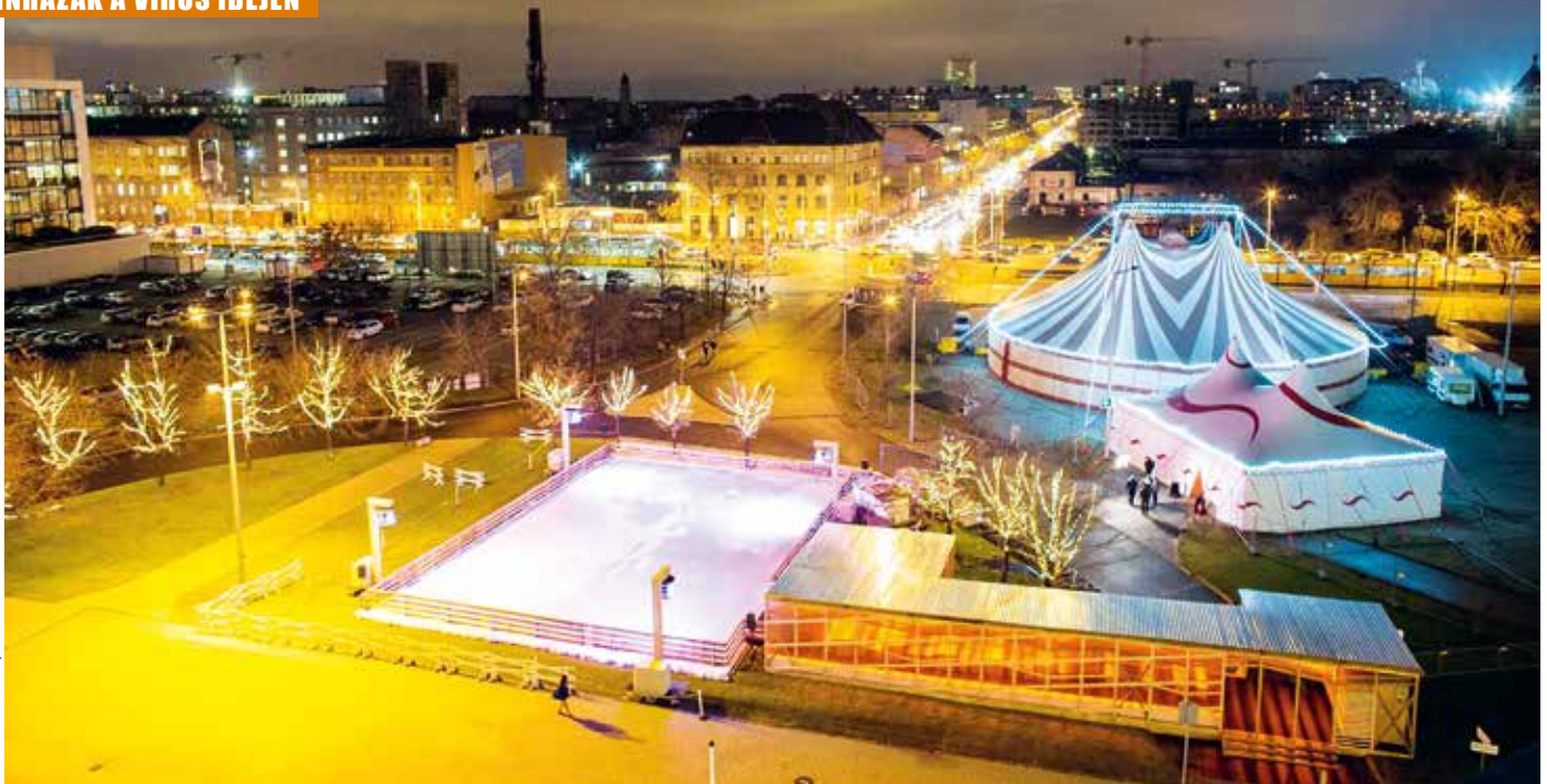
A cirkszásator tavaly

▶ oldaláról zökkenőmentesen lehetne megoldani az A-B hetes munkarendet.