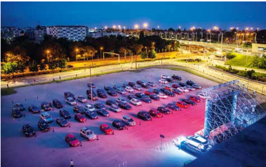
Mozi a parkolóban

Meglepően jól tudunk működni, bár hozzátartozik, hogy igencsak csökkentett számú előadást tudunk tartani, mivel sok produkció elmarad. Ha teljes üzemben mennénk, nem biztos, hogy a műszak