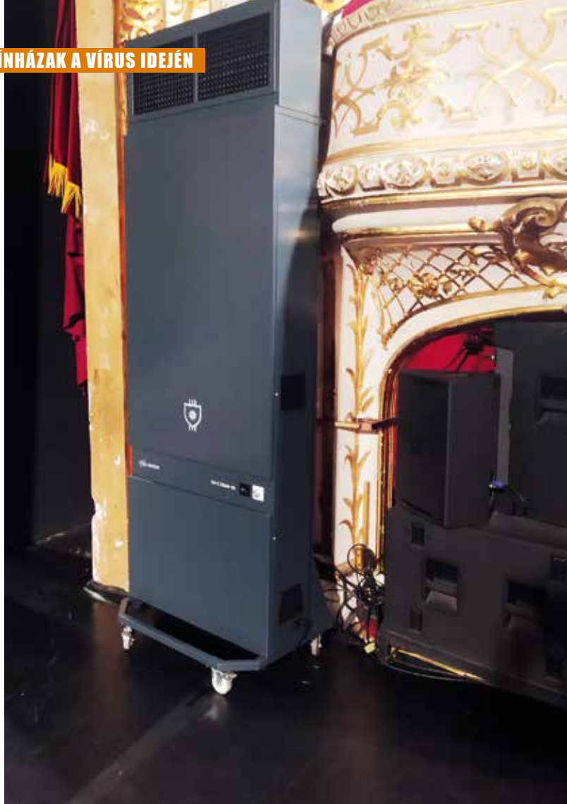
Légtisztító a portálnál elhelyezve