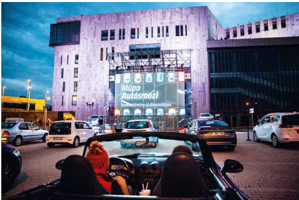
A nyári autósmozi