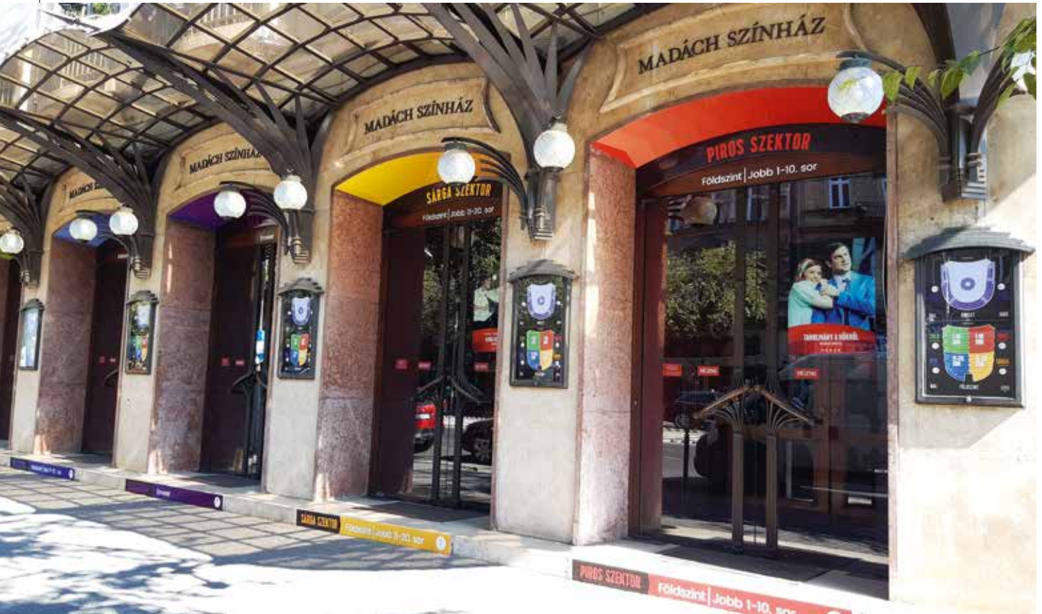
A nézők csak azon a bejáraton mehetnek be, amelyik szektorba szól a jegyük

A nézőtérén szektorrendszert hoztunk létre, amit már a bejáratnál öt szín szerint választunk külön. Ez a kontaktusok minimalizálását szolgálja. Színeknek megfelelően választjuk szét a jegykezelést, ruhatárhasználatot, büféhasználatot, valamint a nézőtérre való belépést. A nézőtér elhagyása soronként hangutasítás szerint történik, ez kiválóan működik, a látogatók maximálisan együttműködők és fegyelmezettek.