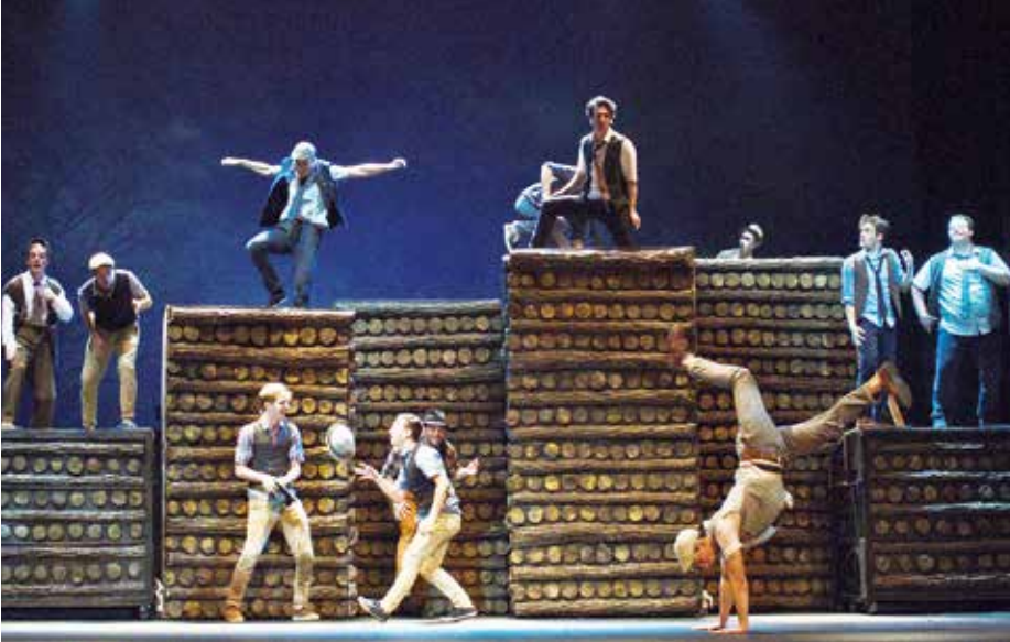
A Pál utcai fiúk előadása a Vígszínházban

A munkát kizárólag tünetmentes, egészséges dolgozók vehetik fel. A szokásos GDPR-os jogi körök megfutása után a színházak között elsőként tettük kötelezővé a nézők számára a testhőmérséklet-mérést és a maszkviselést, aminek ugyan vegyes volt a fogadtatása, de rövidesen kormányzati intézkedés is kötelezővé tette a színházakban.