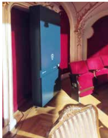
és az erkélyen telepítve