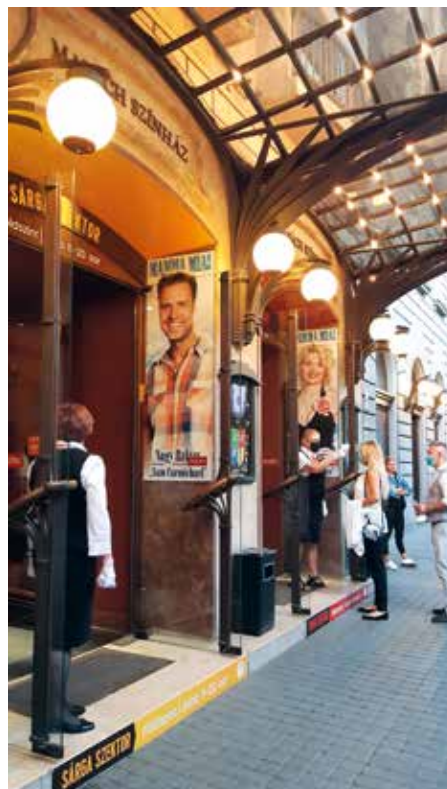
Mérik a nézők hőmérsékletét

Ekkor még különösebb biztonsági és egyéb, a pandémiás helyzetre hozott intézkedés nem volt