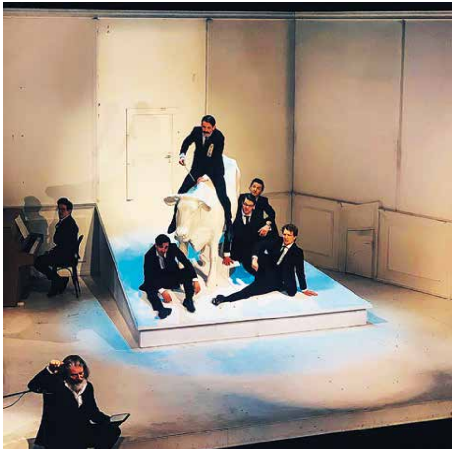
Vecsei H. Miklós: Kinek az ég alatt már senkije sincsen. A Pesti Színház élő közvetítése a Vígszínház Facebook-oldalán

A fenti mértékadó dokumentumok alapján a következő főbb intézkedéseket tettük: