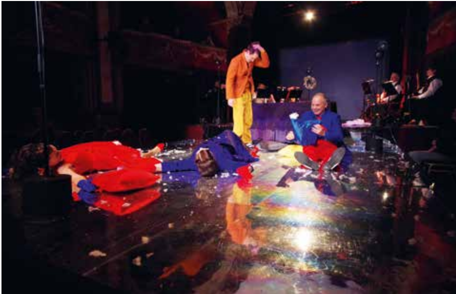
A pódium is tükröző felületű