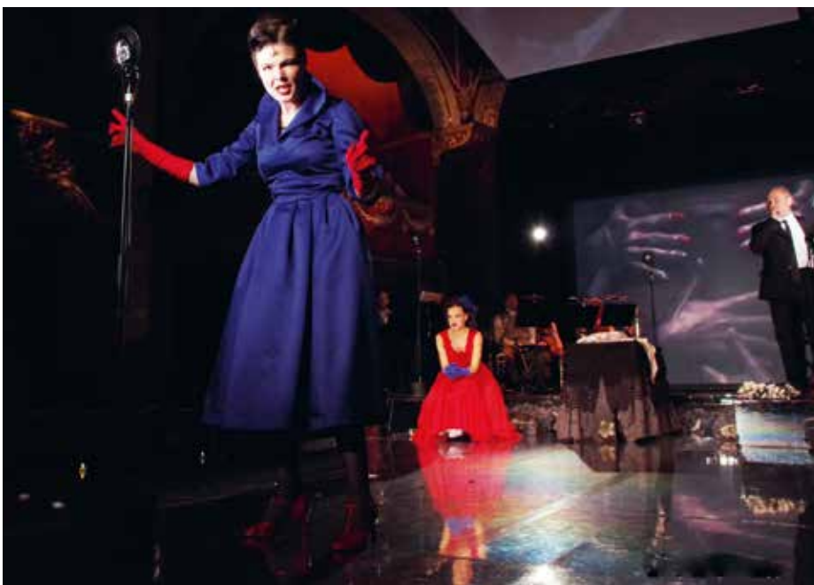
Az arcokat mikrofonokra szerelt ún. Dörr-lámpák világítják meg

tük az arcokat. Szép megoldás lett. A színpadon ülő héttagú zenekart pedig gégeekkel világítjuk, s mögöttük egy nagyon erős képet adó LED-fal zárja le a látványt.